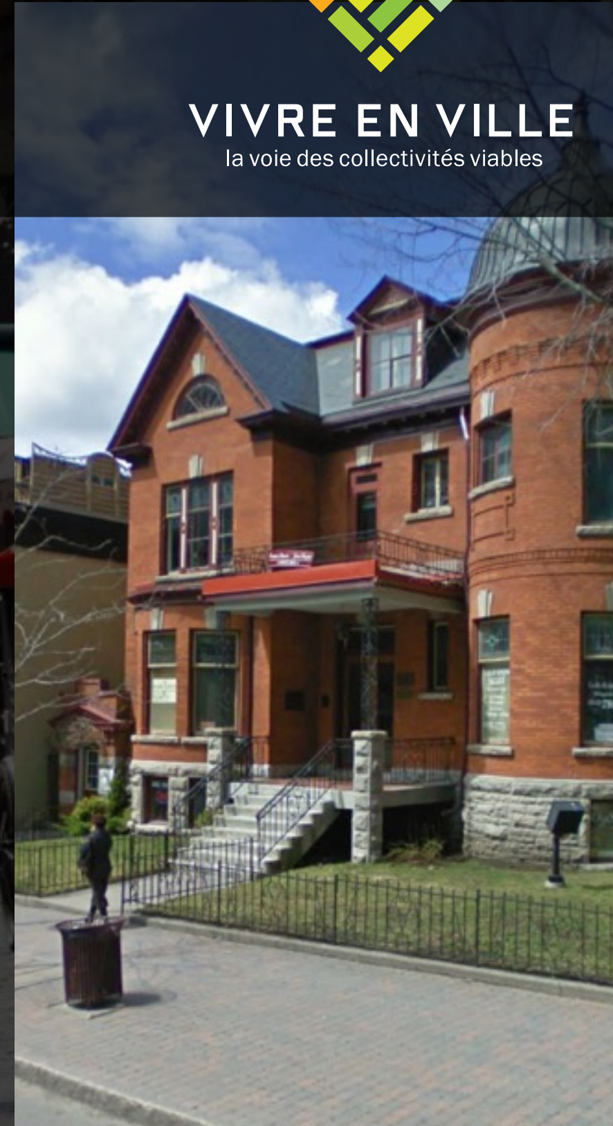
QUÉBEC CENTRE CULTURE ET ENVIRONNEMENT FRÉDÉRIC BACK