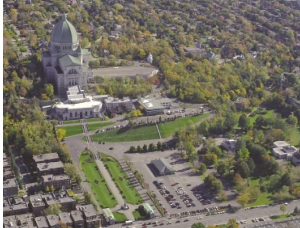
Vue d'ensemble du site actuel.

Ce contact intensif avec le sanctuaire m'a permis de mieux apprécier les qualités et les défauts du site et des opérations. C'est donc sur cette base solide que nous avons ensemble pu définir en détail les solutions à mettre en œuvre.