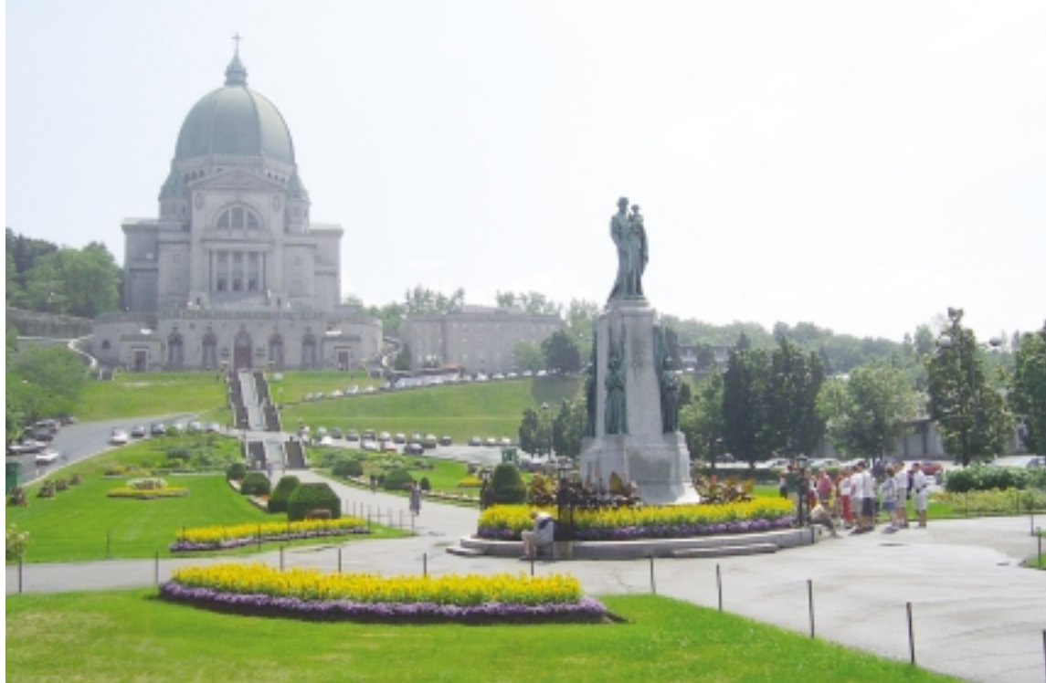
Situation actuelle de l'axe sacré où l'on voit la circulation automobile couper à deux reprises la montée des pèlerins.

par Jean-Pierre Aumont, c.s.c., recteur de l'Oratoire