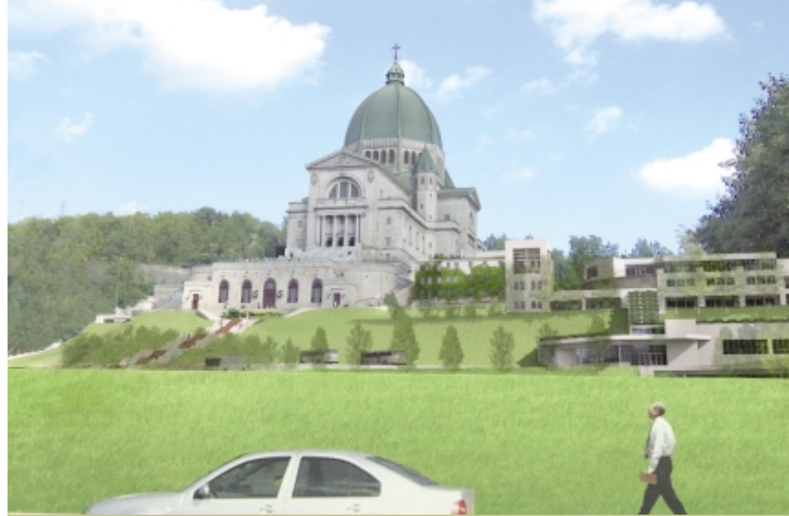
Vue de l'Oratoire depuis le chemin Queen Mary à la fin des travaux. Les espaces verts dominent l'ensemble du site.

Seulement 43 arbres seront coupés, soit environ 5 % des arbres situés dans les secteurs aménagés de l'Oratoire, et moins de 1 % des arbres situés sur l'ensemble du site. Douze (12) de ces arbres ont une cote de santé et d'intégrité structurale égale ou inférieure à 60 %, ce qui signifie que leur espérance de vie est limitée. Les autres arbres qui seront coupés en raison des