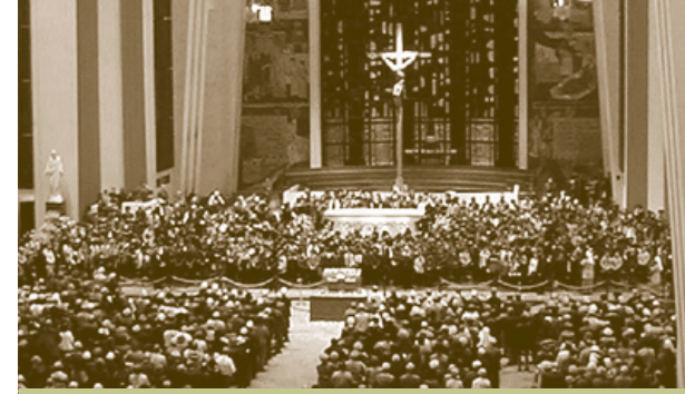
Les célébrations à l'Oratoire sont bien fréquentées.

par Jean-Pierre Aumont, c.s.c., recteur de l'Oratoire