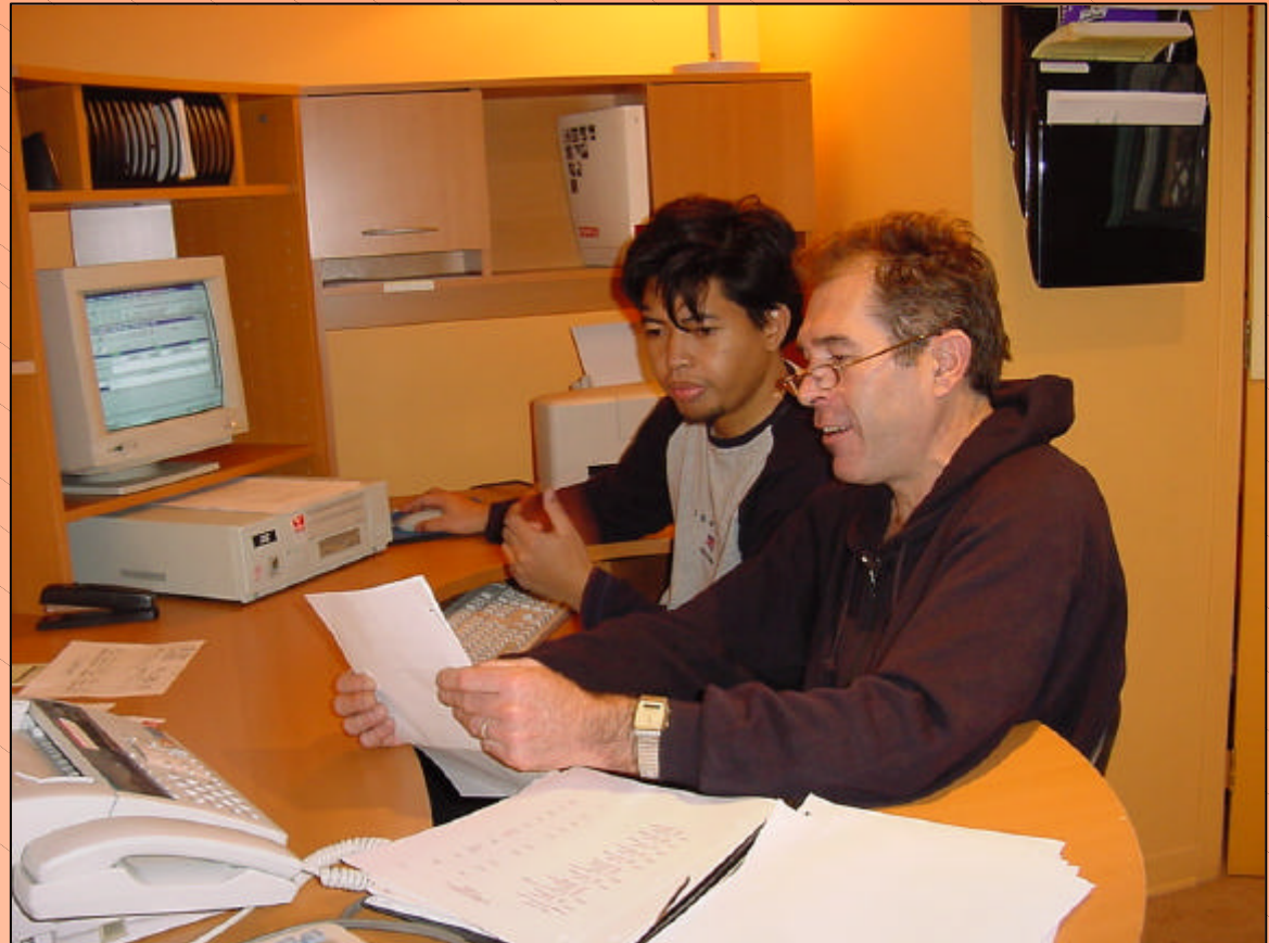
Comité des finances de la coop Le Clan des pacifistes, Place Valade Rosemont-La Petite-Patrie