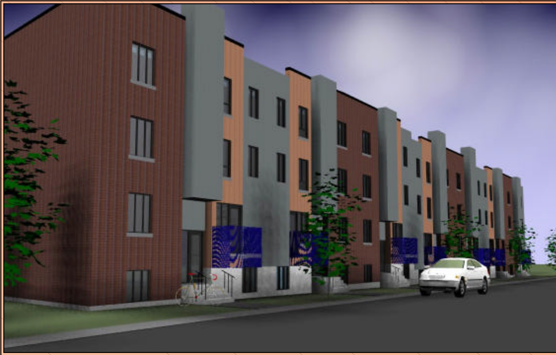
Coopérative Le Fleuve de l'Espoir Montréal-Est