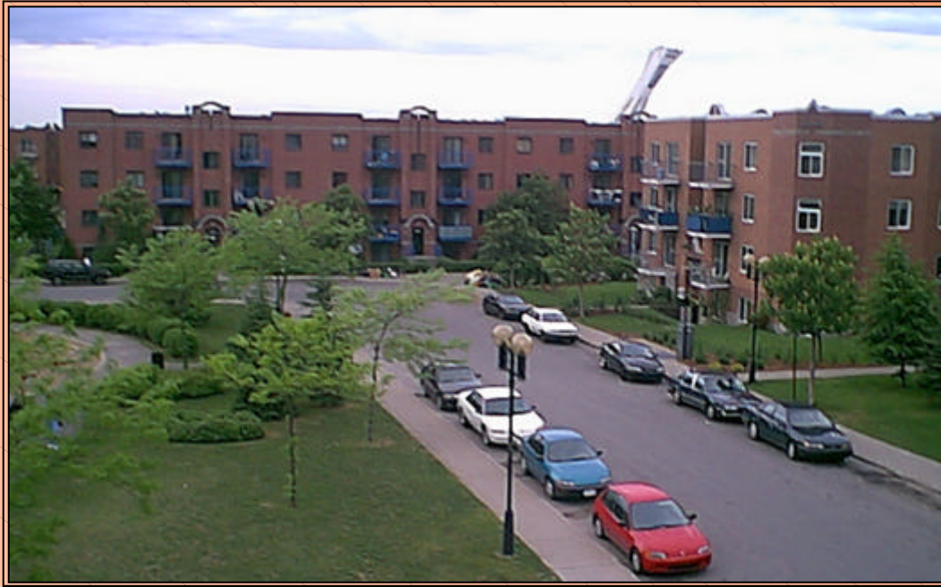
Place Valade Terrains Angus Rosemont / La Petite-Patrie