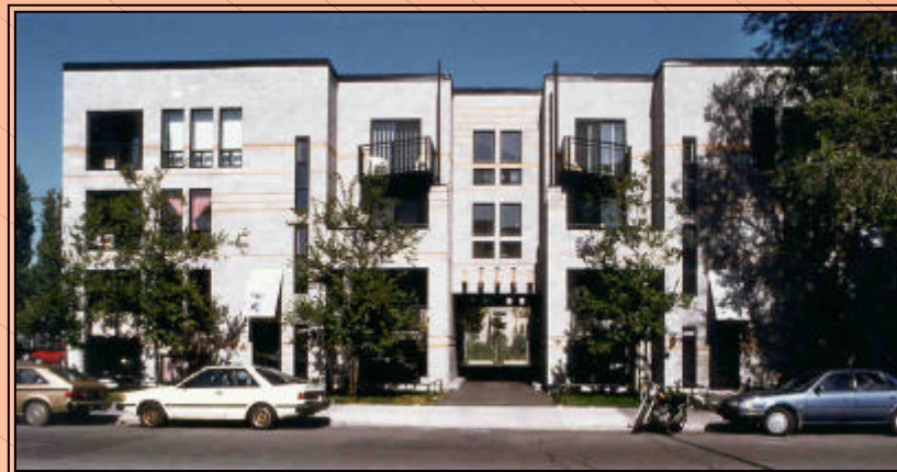
Habitations Rachel Plateau Mont-Royal