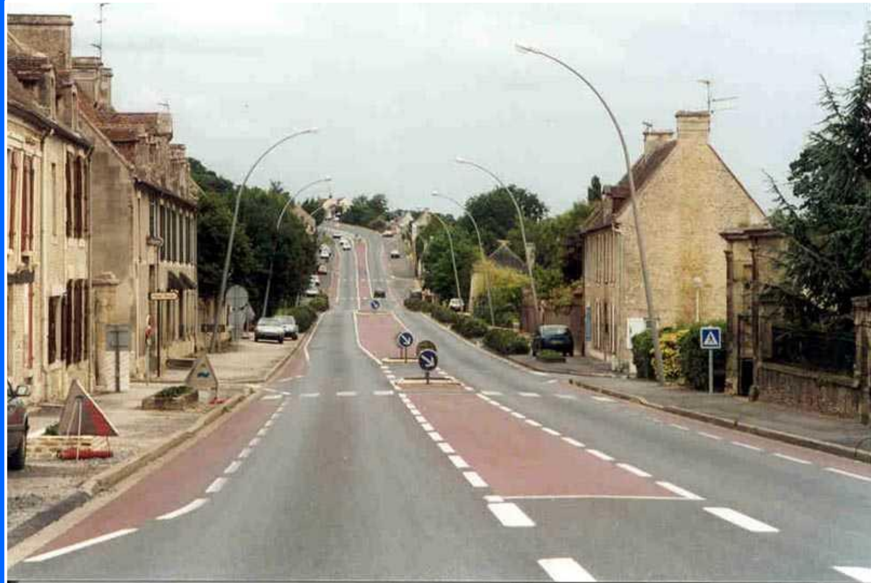
Moulins, France