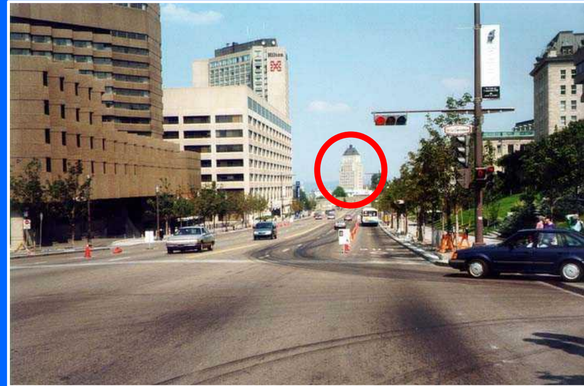
Boulevard René-Lévesque, Québec