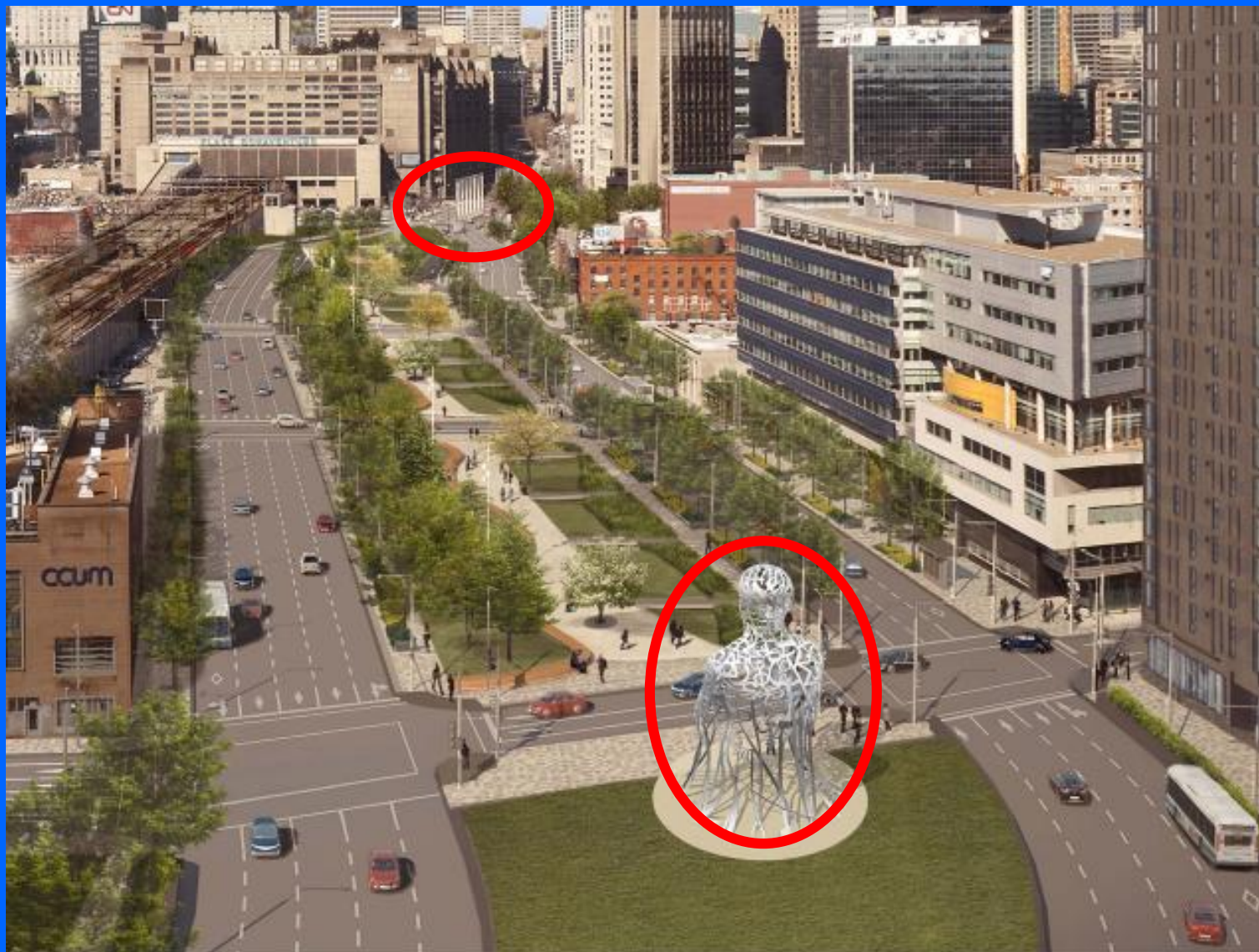
Boulevard Robert-Bourassa, Montréal