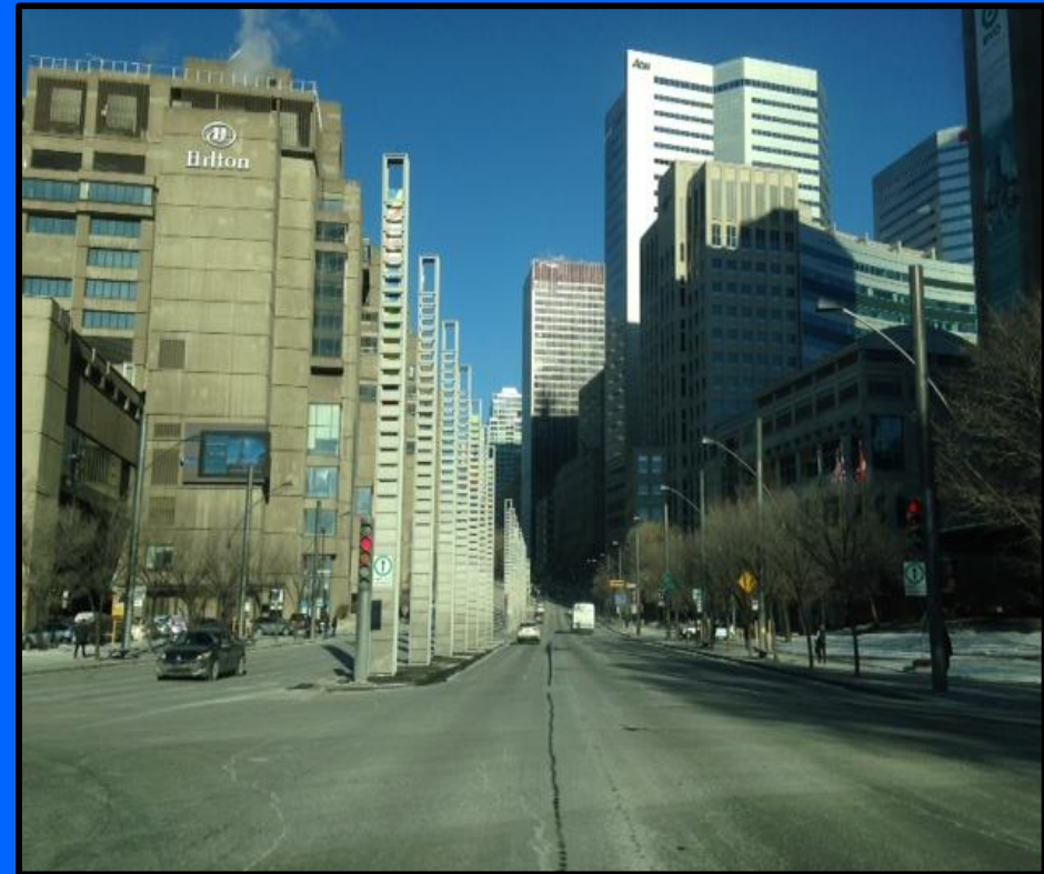
Montréal, Québec