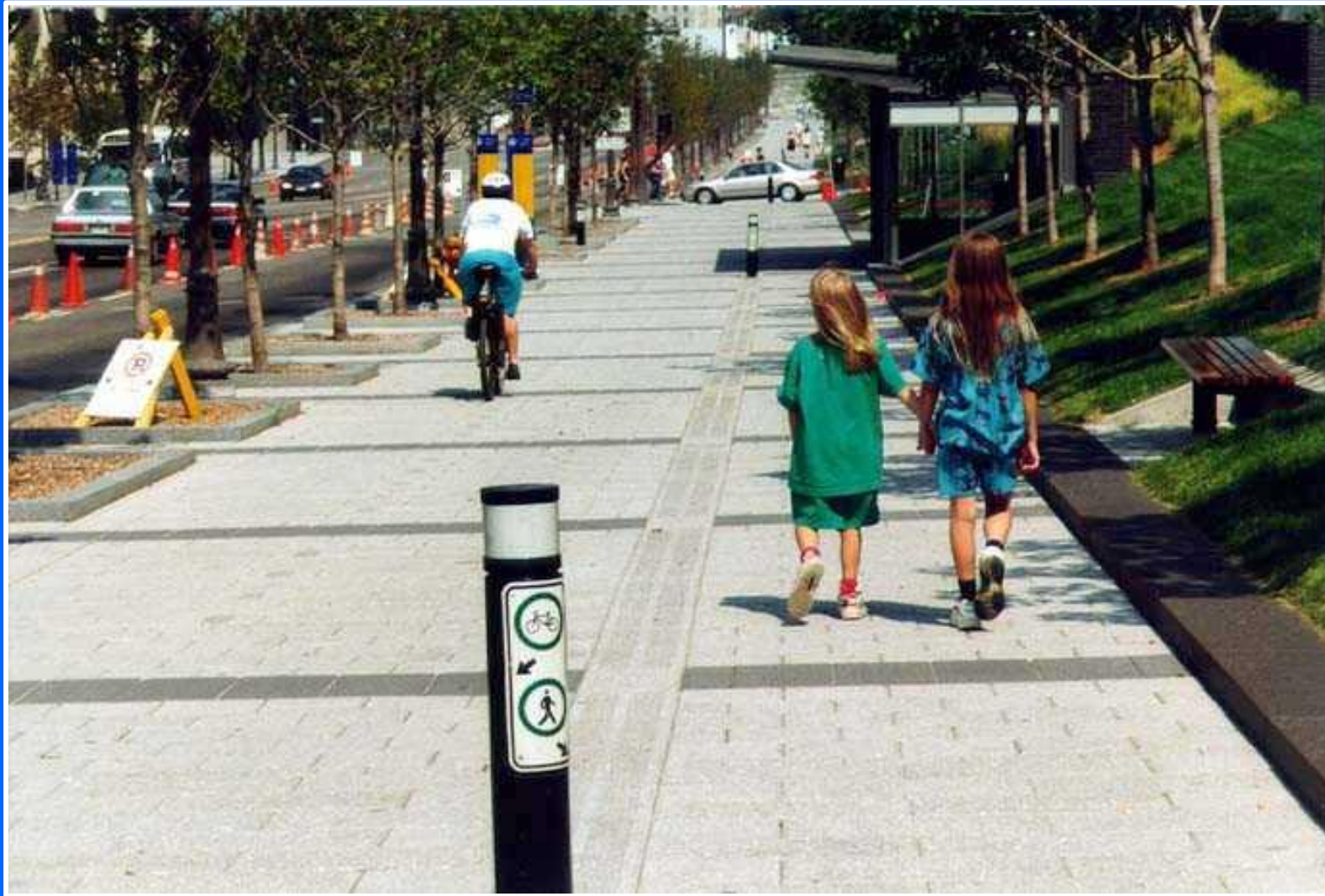
Boulevard René-Lévesque, Québec