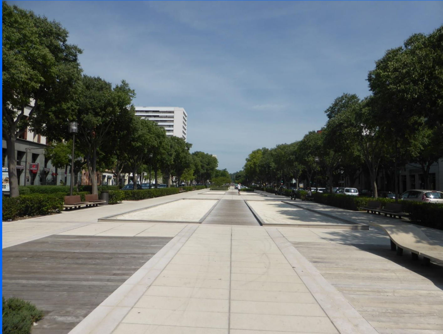
Avenue Jean-Jaurès, Nîmes, France