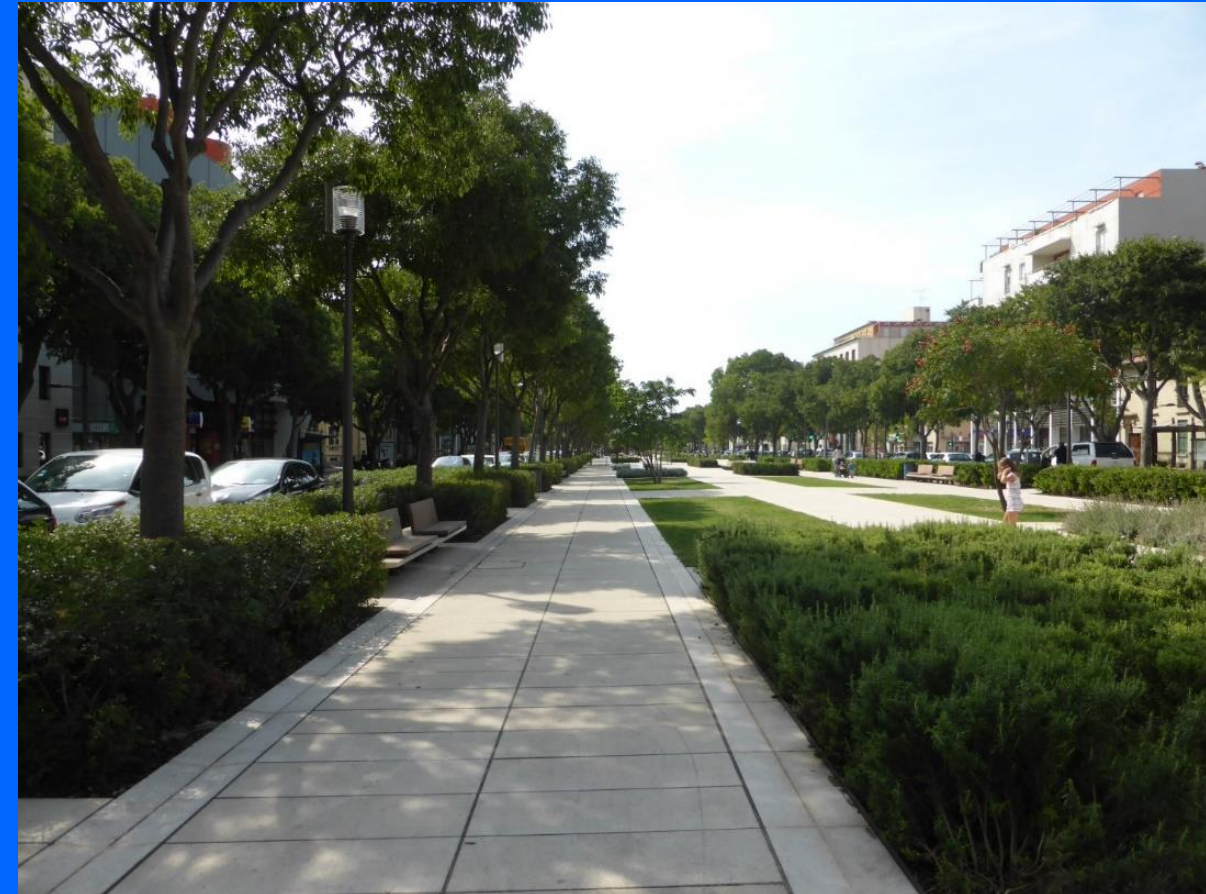
Avenue Jean-Jaurès, Nîmes, France