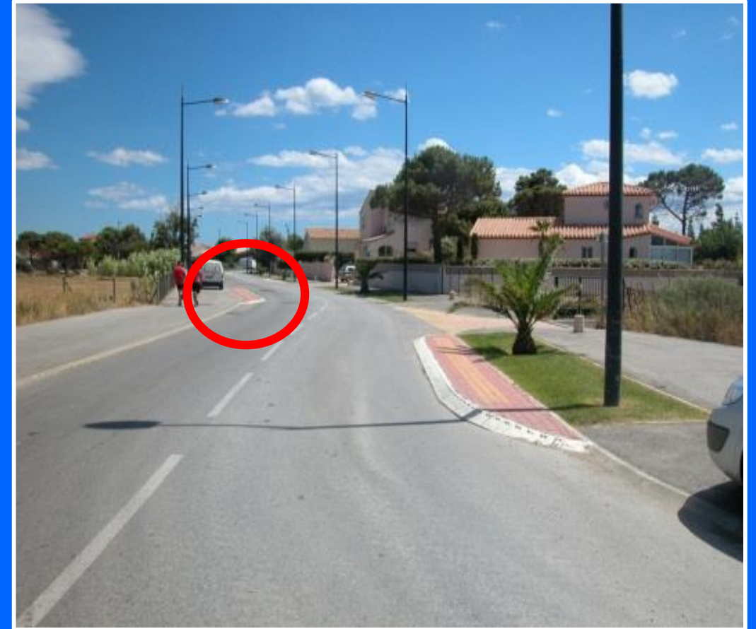
Villeneuve Les Sablons et Barcarès, France