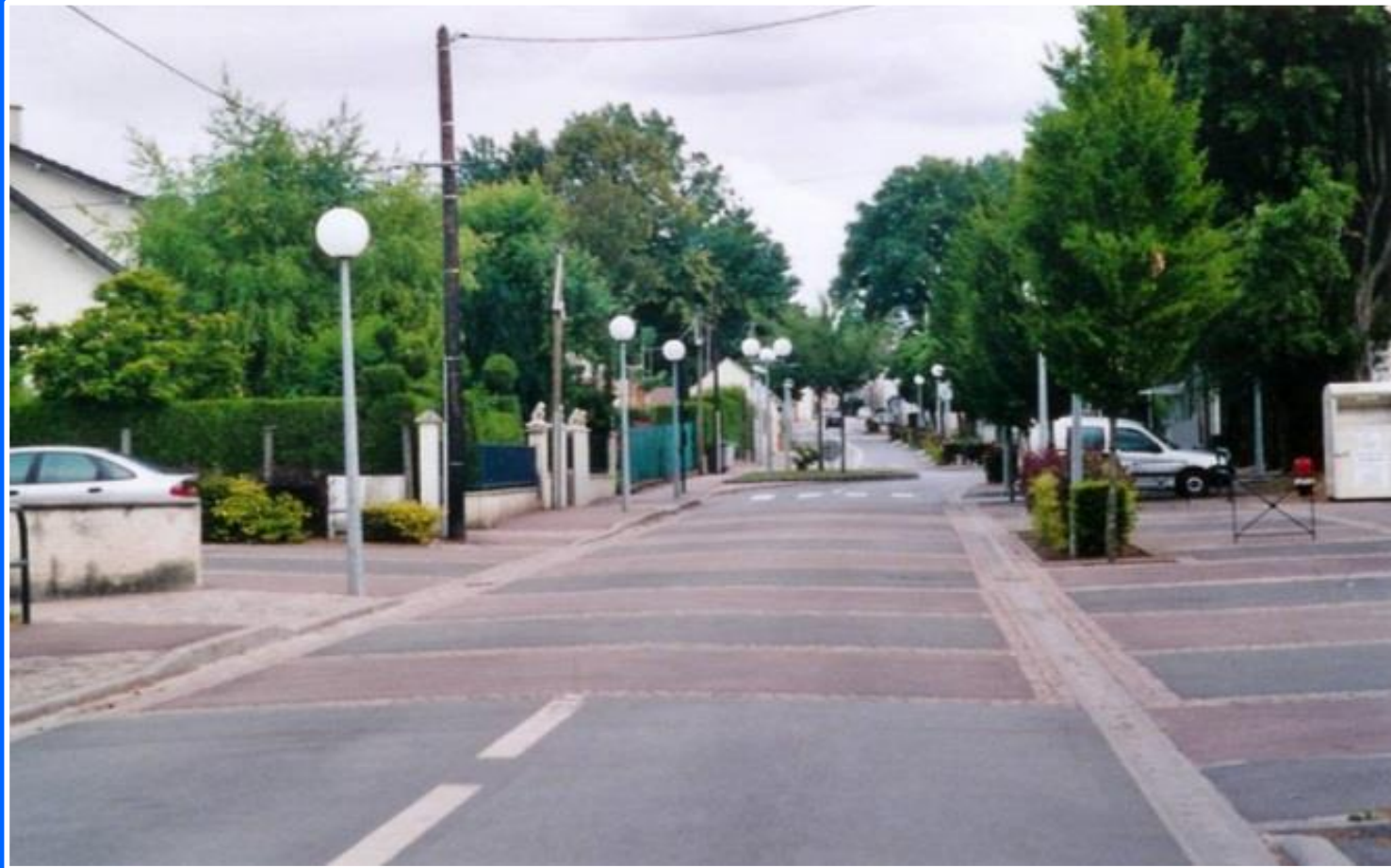
Survilliers, France