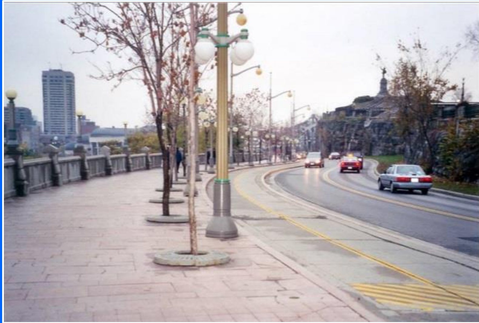
Ottawa, Ontario