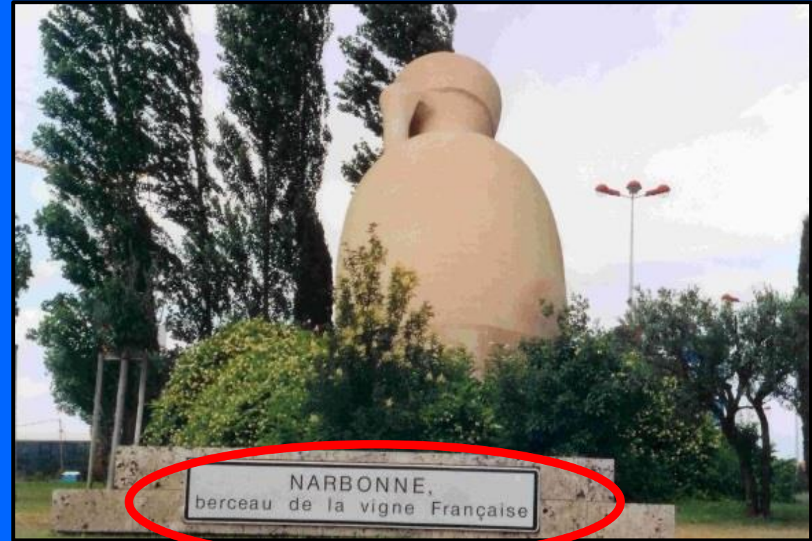
Narbonne, France