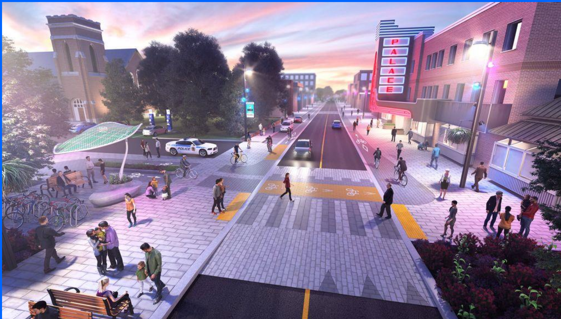
Rue Principale, Granby