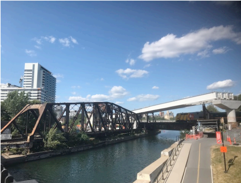
Pont tournant, vu du pont automobile rue Wellington, août 2019.

Une portion de l'autoroute Bonaventure, longeant le fleuve St Laurent, est sous responsabilité du gouvernement fédéral sous le mandat de la Société des ponts Jacques-Cartier. L'idée de déplacer cette portion de l'autoroute sur l'axe de la rue Marc Cantin afin d'offrir l'accès au fleuve à tous est une idée intéressante qui serait envisagée positivement par un gouvernement néo-démocrate.