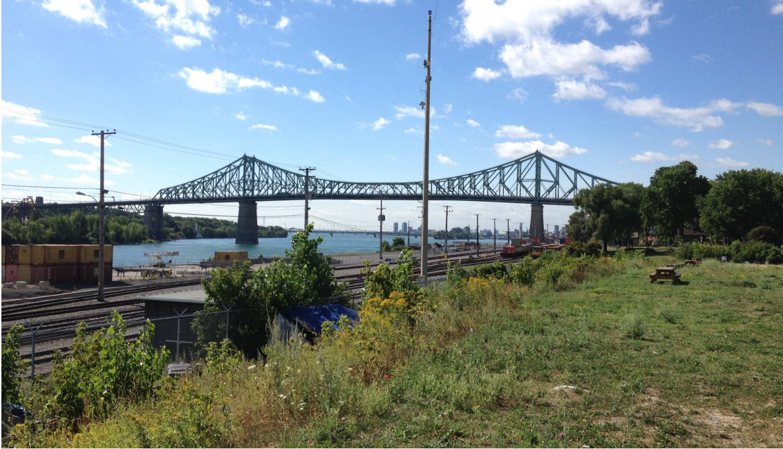
Figure 7. Perspective depuis le terrain riverain situé à l'est du parc Au-Pied-du-Courant

surplomb du fleuve lorsqu'on s'éloigne du pied-du-courant. Lors du réaménagement du faubourg Québec sur la cour de triage du CP au début des années 2000 (à l'ouest de la rue Amherst), d'importants remblais ont été réalisés. Cette situation topographique particulière est soulignée notamment par l'aménagement, en 2012, du Belvédère du Chemin-qui-marche, au-dessus des premières voies ferrées du CP (entre les rue Saint-Hubert et Amherst).