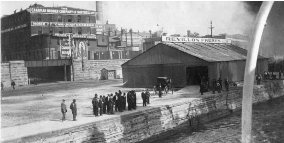
Figure 3. 1909 – Vue du quai dans l'axe de l'avenue Papineau et le bâtiment de la Canadian Rubber à l'arrière plan.

À la même période, la gare Dalhousie (1882) est construite par le Canadien Pacifique, ainsi que ses voies de chemin de fer qui longent la rive vers l'est, pour remonter vers la cour de triage Hochelaga puis vers le nord de la ville. La construction de la gare Viger et de la cour de triage attenante, entre 1898 et 1910, implique la démolition d'une partie du faubourg Québec, au sud de la rue Saint-Antoine. De plus, cette installation modifie complètement le relief entre les rues Berri et Beaudry puisque la colline est aplanie pour accueillir les voies ferrées. Le nombre de voies qui passent sur la rive augmente, les quais sont agrandis et des entrepôts y sont bâtis.