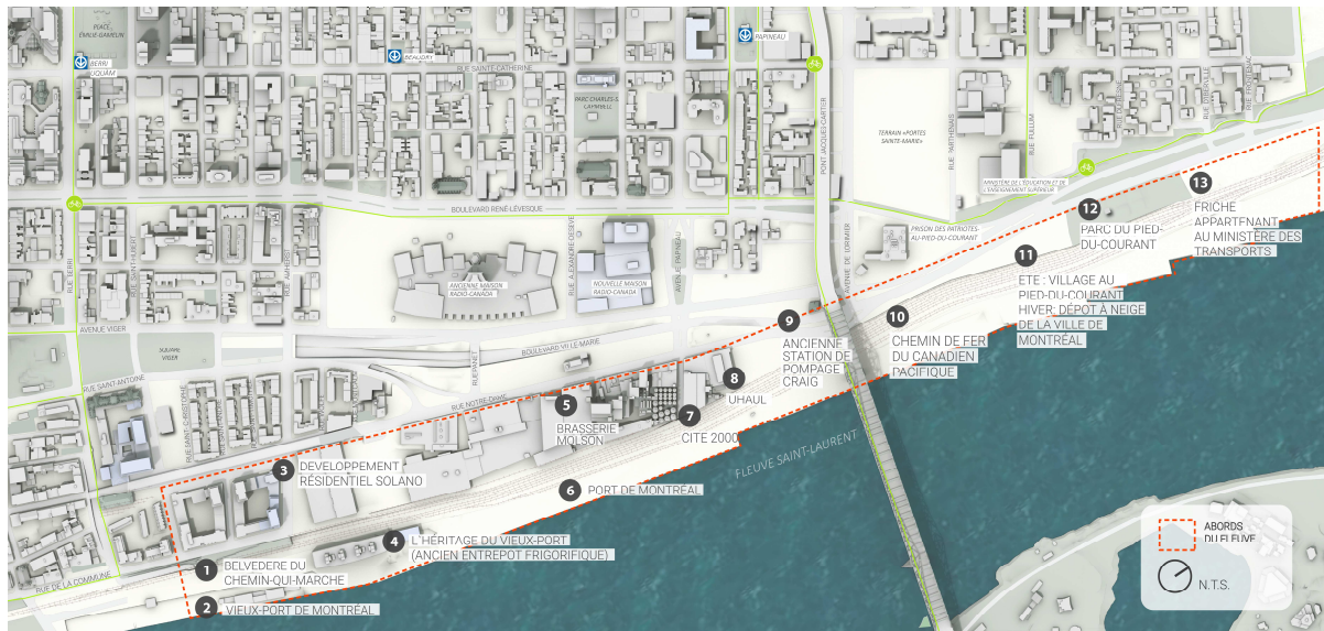
Figure 1 - Plan de localisation

Dans le secteur des Faubourgs, à la sortie du Vieux-Montréal, la rue Notre-Dame se rapproche du rivage du fleuve tandis que le territoire du Port de Montréal commence. Les terrains riverains situés entre ces deux voies de communication - la rue Notre-Dame et le fleuve - sont marqués par le développement industriel et les infrastructures de transport des marchandises. Aux extrémités est et ouest, d'autres occupations sont aussi présentes.