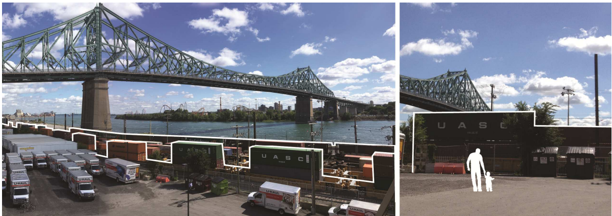
Figure 6 – Absence de perspective vers le fleuve depuis le stationnement (2018)

À l'ouest du pont, les terrains riverains sont constitués de deux propriétés privées. Le terrain appartenant à U-Haul comprend un ancien bâtiment de la Canadian Rubber (1854) reconverti en une centaine de locaux de répétition de musique (Cité 2000), le bâtiment et le stationnement de l'entreprise de location de véhicules. S'étend ensuite le terrain de la brasserie Molson (voir fiche 3).