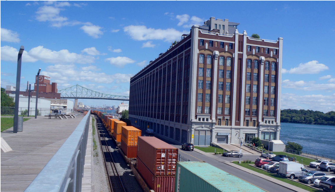
Figure 8. Vue vers l'est, depuis le belvédère du Chemin-qui-marche