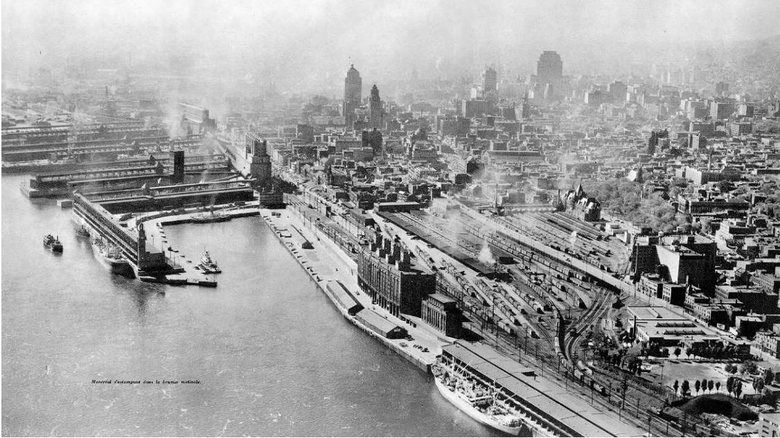
Figure 2. Les installations du Port de Montréal, l'entrepôt frigorifique et la gare de triage Viger à l'arrière. À l'extrémité droite, le parc Campbell. Source : Surveys Ltd., vers 1955

À la même période, la gare Dalhousie (1882) est construite par le Canadien Pacifique, ainsi que ses voies de chemin de fer qui longent la rive vers l'est, pour remonter vers la cour de triage Hochelaga puis vers le nord de la ville. La construction de la gare Viger et de la cour de triage attenante, entre 1898 et 1910, implique la démolition d'une partie du faubourg Québec, au sud de la rue Saint-Antoine. De plus, cette installation modifie complètement le relief entre les rues Berri et Beaudry puisque la colline est aplanie pour accueillir les voies ferrées. Le nombre de voies qui passent sur la rive augmente, les quais sont agrandis et des entrepôts y sont bâtis.