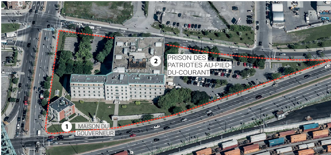
Figure 5 – Photo aérienne du site

depuis 1989, prenant le relais du ministère de la Culture et des Communications. Elle détiendra à 100 % la maison du gouverneur et la prison.