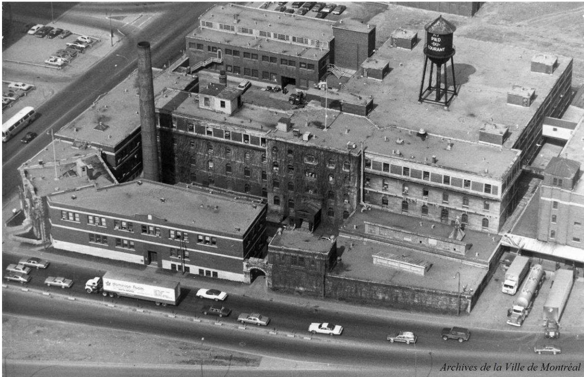
Figure 4 - Régie des alcools du Québec, 1970.

Dans les années 1980, le prolongement vers l'est du boulevard René-Lévesque jusqu'à la rue Notre-Dame isole la prison et entraîne la formation d'un îlot triangulaire, tel qu'il est constitué aujourd'hui.