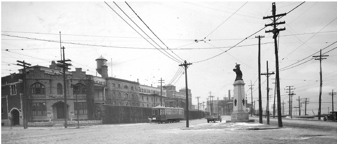
Figure 3 - Place des Patriotes et Maison du gouverneur, 1926.

En 1926, un monument est érigé en l'honneur des Patriotes en face de la maison du gouverneur, à l'angle de la rue Notre-Dame et de l'avenue De Lorimier.