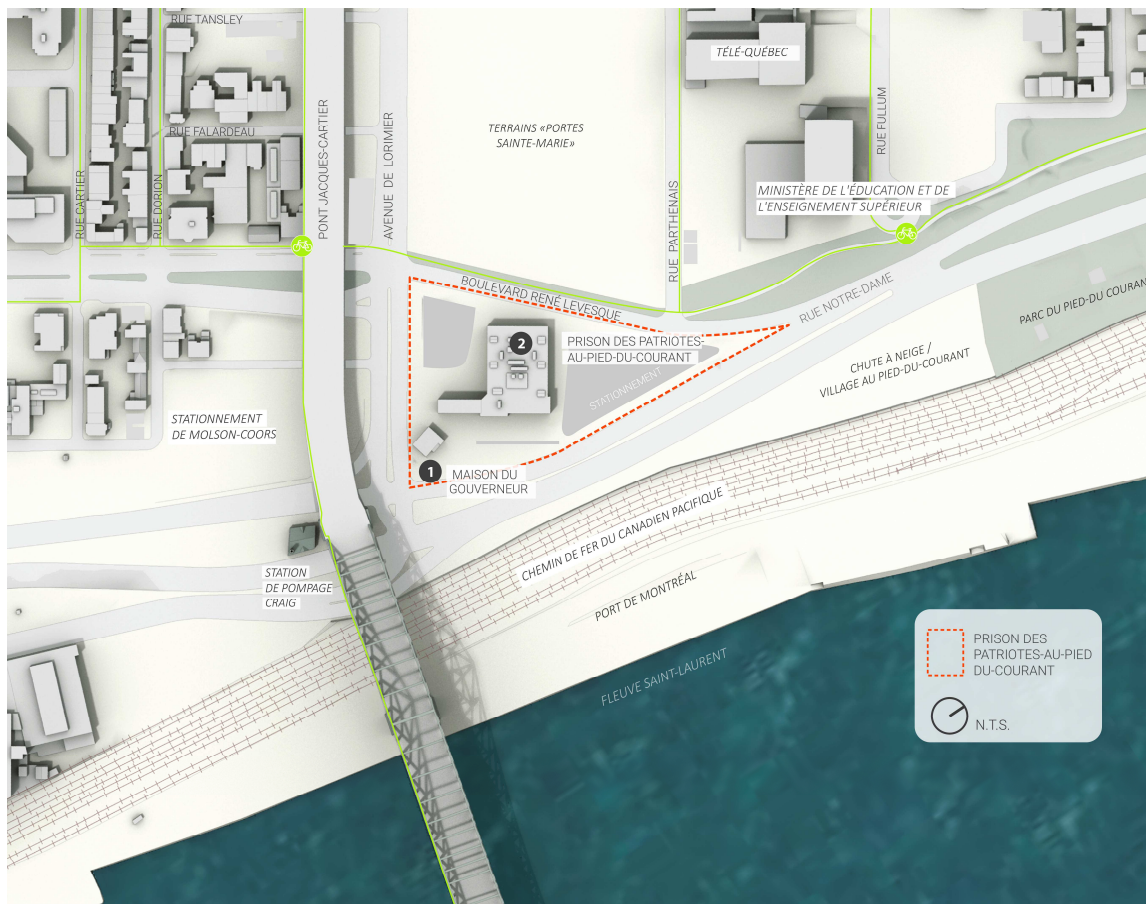
Figure 1 - Plan de localisation

Le site historique de la prison des Patriotes-au-Pied-du-Courant constitue un héritage culturel fortement symbolique datant de la première moitié du 19 e siècle. À la suite de plusieurs réaménagements du réseau routier, il se retrouve isolé sur un îlot entouré d'artères fortement achalandées.