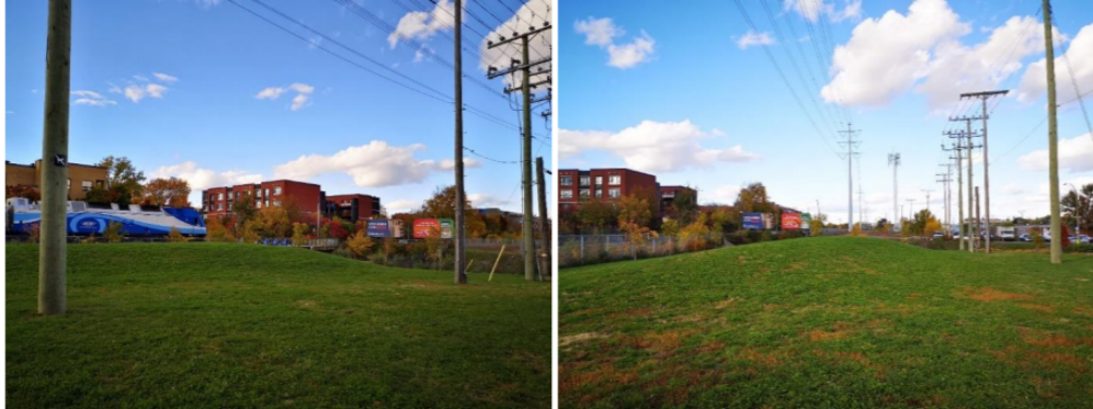
Figures 41 (gauche) et 42 (droite) : Espace disponible sur le terrain d'Hydro.

En plus d'encourager, tous les déplacements actifs, l'installation d'une passerelle pourrait offrir encore plus de sécurité aux utilisateurs les plus vulnérables, tels que les enfants et adolescents et les aînés. Il est important de souligner que, selon les données de l'enquête OD 2013, les enfants et les jeunes jusqu'à 20 ans représentent le plus grand groupe parmi les cyclistes et les piétons à Ahuntsic. »