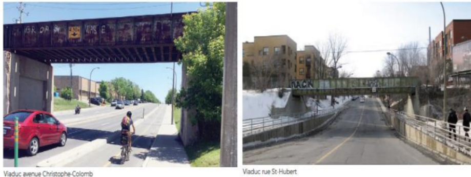
Figures 39 (gauche) et 40 (droite) : Viaduc au côté de la voie ferrée.

La priorisation de la sécurité des déplacements actifs peut rencontrer un obstacle dans la présence des viaducs de la voie ferrée des rues Saint-Hubert et Christophe-Colomb. Les viaducs constituent une barrière pour les piétons et les cyclistes qui veulent traverser ces rues. À côté de la voie ferrée il existe un sentier polyvalent dans le terrain d'Hydro-Québec qui aurait une connexion potentiellement plus directe au métro Sauvé, reliant via la rue Lajeunesse.