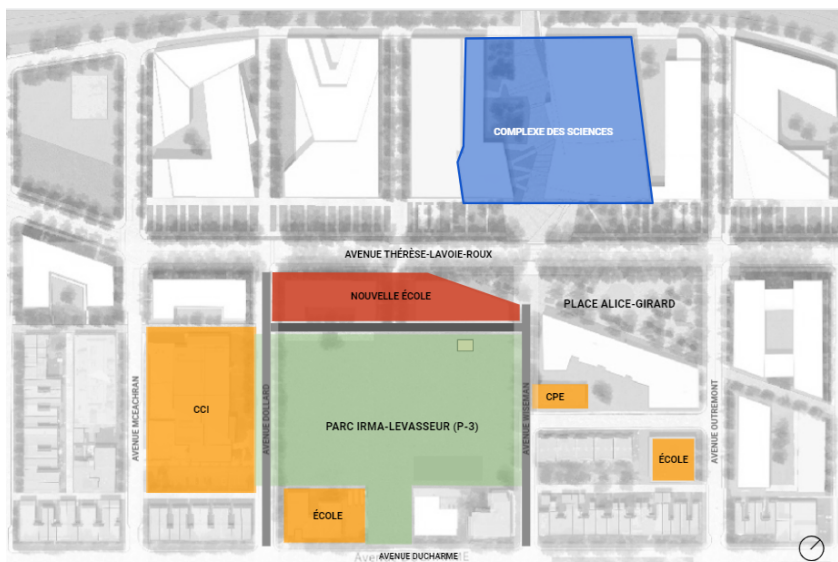
Plan de localisation de la future école primaire au nord du parc Irma-LeVasseur

Finalement, l'aménagement du parc P-1 est prévu à plus long terme, soit vers 2030, et ne permettrait donc pas de répondre aux besoins immédiats du CSSMB.