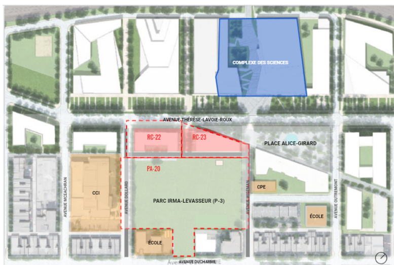
Plan d'aménagement initial comprenant les lots RC 22 et RC-23 destinés à un développement résidentiel et le lot PA-20 du parc Irma-LeVasseur

Le projet d'école primaire sera réalisé sur un terrain où était prévu un développement résidentiel. La construction de l'école primaire n'hypothèque donc aucunement la superficie du parc Irma-LeVasseur limitrophe, dont l'empreinte reste la même que celle présentée dans le plan d'ensemble adoptée en 2011 par le conseil municipal. Le projet d'école primaire n'implique donc pas la réduction de la superficie d'espaces verts prévus dans le cadre de la mise en œuvre du projet.