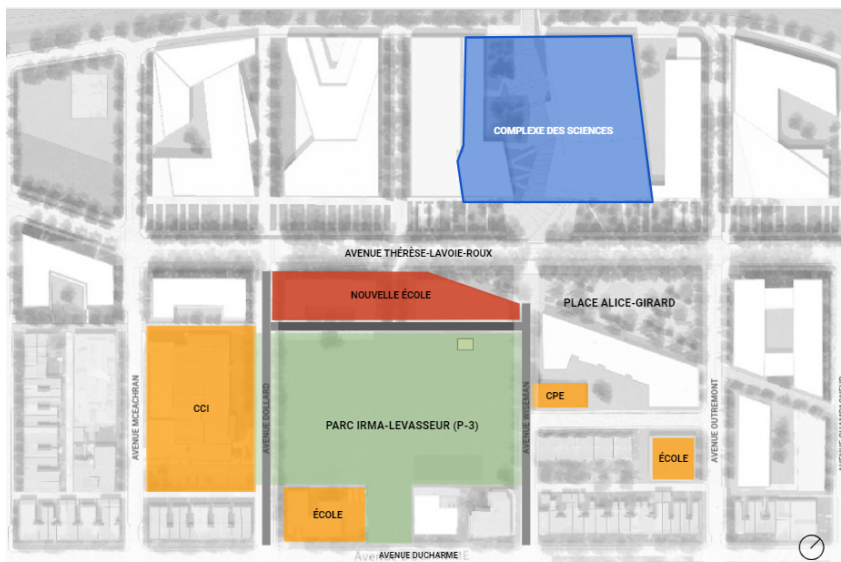
Plan de localisation de la future école primaire au nord du parc Irma-LeVasseur

L'intégration d'une école primaire dans ce nouveau quartier ne réduit pas la superficie du futur parc Irma-LeVasseur (P-3), ni des autres espaces verts prévus au plan d'ensemble adopté en 2011 par le conseil municipal. Le projet d'école primaire est localisé sur un terrain où étaient prévus des bâtiments résidentiels. L'ensemble des 4 hectares de nouveaux espaces verts prévus seront donc réalisés dans le cadre de la mise en œuvre du projet.