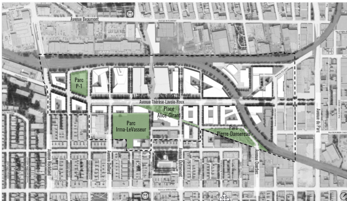
Plan des espaces verts réalisés et prévus au plan d'ensemble de 2011

Les nouveaux espaces verts aménagés sur l'ancienne gare de triage sont précisés au plan d'ensemble adopté en 2011 par le conseil municipal, dans lequel est également identifié le développement institutionnel et résidentiel. La superficie totale a été établie en fonction du développement ultime du secteur, incluant 1 300 logements. Celle-ci a d'ailleurs été bonifiée à la suite des consultations tenues à l'OCPM en 2007 pour mieux prendre en compte les besoins du secteur élargi. Elle atteint aujourd'hui près de 4 hectares.