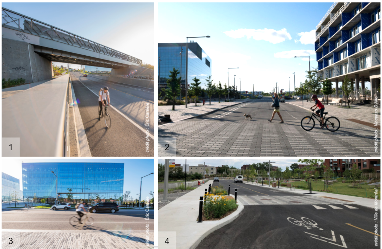
Aménagements cyclables adaptés au type de rue et à la circulation (1 et 3, piste surélevée et bande cyclable sur l'avenue Thérèse-Lavoie-Roux, 2 : bandes cyclables sur l'avenue Outremont, 4 : chaussée désignée sur l'avenue Marie-Stéphane, aux abords du parc Pierre-Dansereau)

Finalement, des mesures d'apaisement de la circulation véhiculaire ont également été implantées aux différentes intersections afin de sécuriser les déplacements des usagers les plus vulnérables.