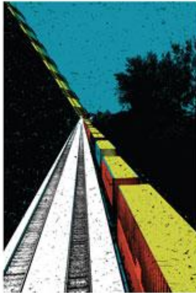
REM de l'Est Les mirages