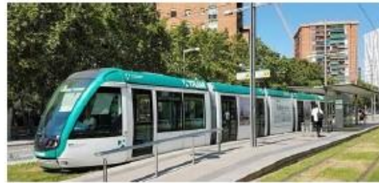
Tram de Barcelone

Des alternatives bien moins coûteuses existent, dont le tramway promis par la CAQ aux dernières élections.