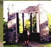
Photo montage de ruines provenant des jardins de l'ancien premier ministre William Lyon Mackenzie King dans le parc de la Gatineau qui a servi d'inspiration pour le développement du concept