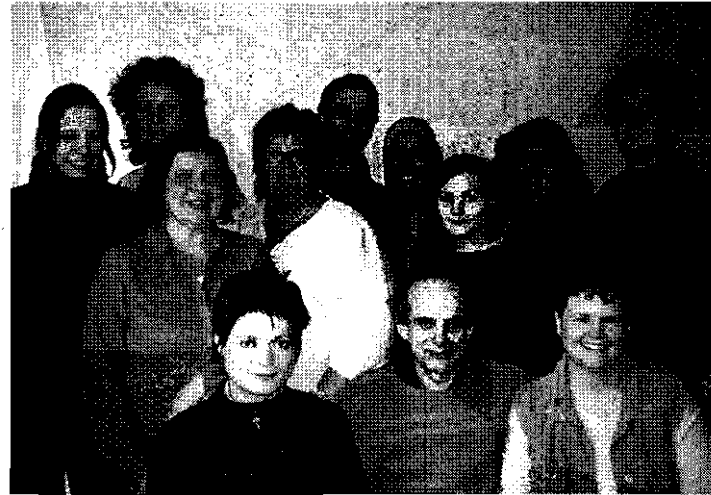
PHOTO: Membres de la Table logement / aménagement de La Petite Patrie

6 % de logements sociaux sont disponibles dans La Petite Patrie.