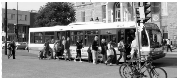
MONTRÉAL, VILLE AVEC ENFANTS

La diversité culturelle de notre ville. L'expérience nous a amenés à voir dans cette diversité une occasion d'ouverture sur le monde et d'enrichissement. De très nombreux parents choisissent donc la ville précisément parce qu'elle offre un contact avec la diversité sous toutes ses formes.