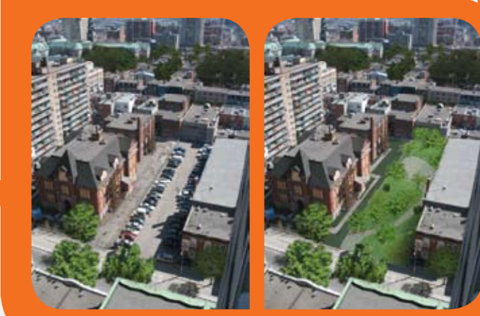
Avant/après : nouveau parc sur le boulevard De Maisonneuve