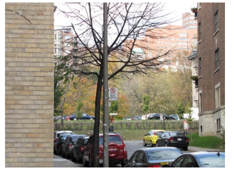
10. rue Chomedey