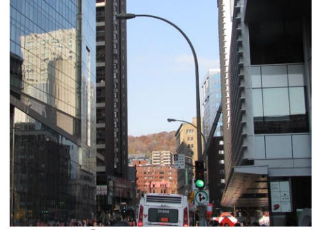
28. rue Guy