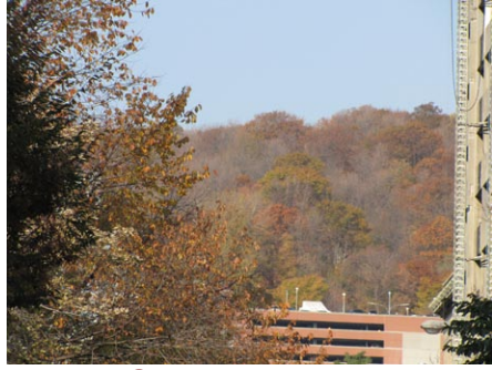
26. rue Saint-Marc