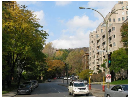
1. avenue Atwater