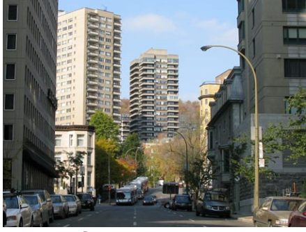
13. rue Saint-Mathieu