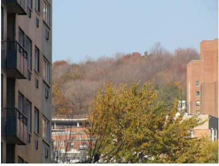
25. rue du Fort