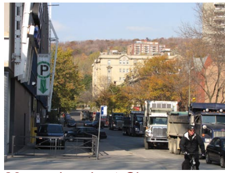
23. rue Lambert-Closse