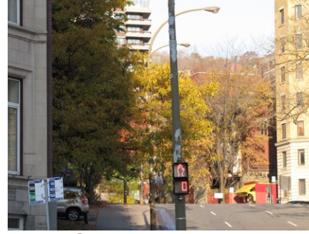
6. rue Saint-Mathieu