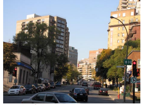
7. rue Guy