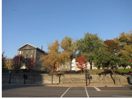
5. rue Saint-Marc