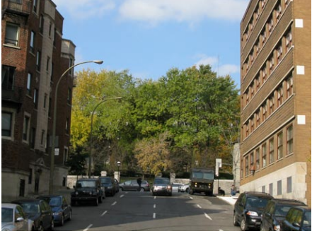
11. rue du Fort