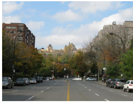
8. avenue Atwater