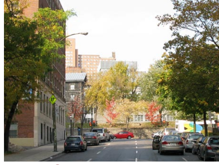
12. rue Saint-Marc