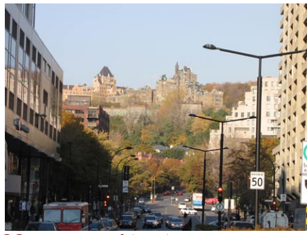
22. avenue Atwater