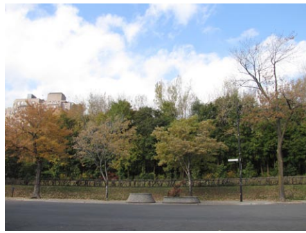
2. rue Lambert-Closse