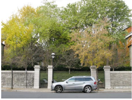
4. rue du Fort