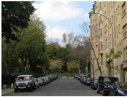
9. rue Lambert-Closse