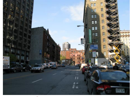
14. rue Guy