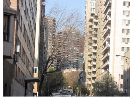
27. rue Saint-Mathieu