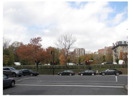
3. rue Chomedey