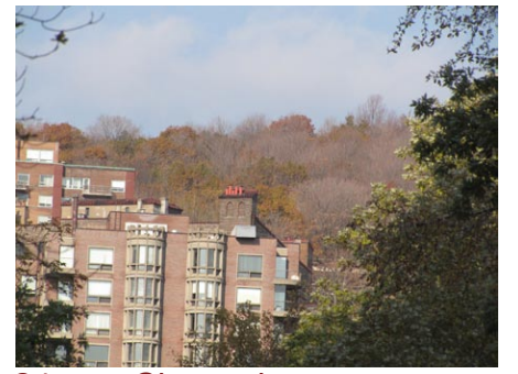
24. rue Chomedey