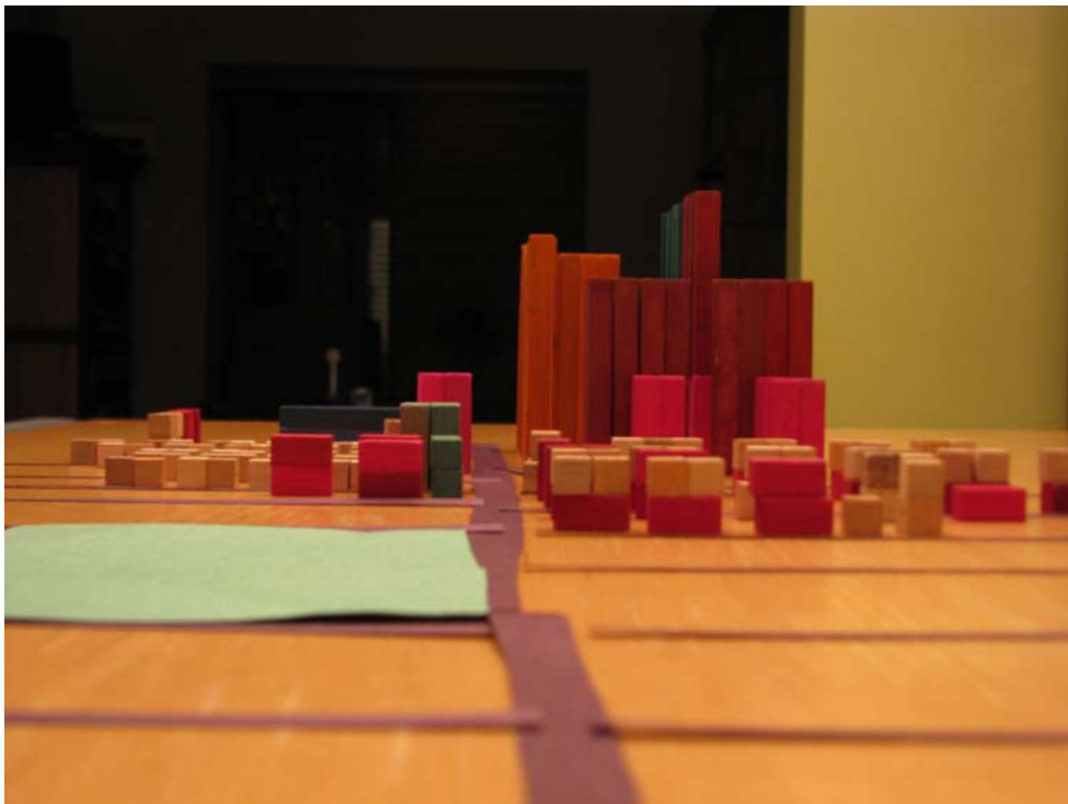
PHOTO 3. Vue de loin du centre du Boulevard Henri-Bourrassa, avec le Parc St-André-Apôtre en vert.