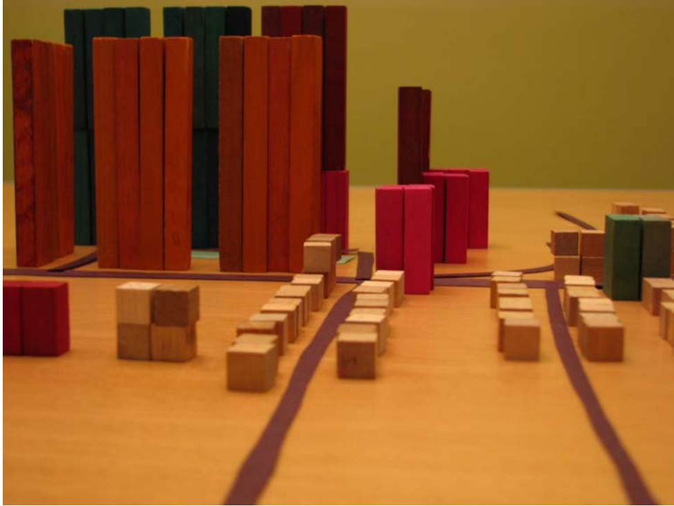
PHOTO 2. Démonstration des hauteurs des bâtiments du Projet Musto avec les duplex, quadruplex et maisons d'un étage en semi-détachés des rues avoisinantes.