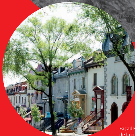
Façades historiques de la rue Saint-Denis