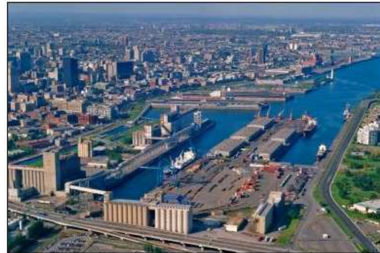
Havre de Montréal

Le Vieux-Montréal peine à affirmer son caractère riverain et portuaire et l'histoire qui y est reliée. La Ville doit faire preuve de leadership pour redonner aux Montréalais accès au fleuve.