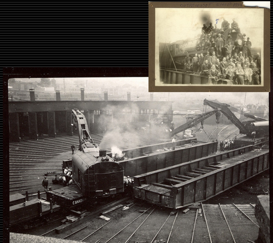
Canadian Pacific Railway Roundhouse & Turntable. Outremont Shops 1942