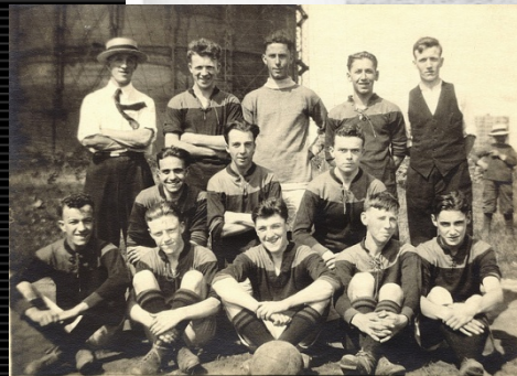
ST. Cuthbert's Junior Church League Soccer Team 1922