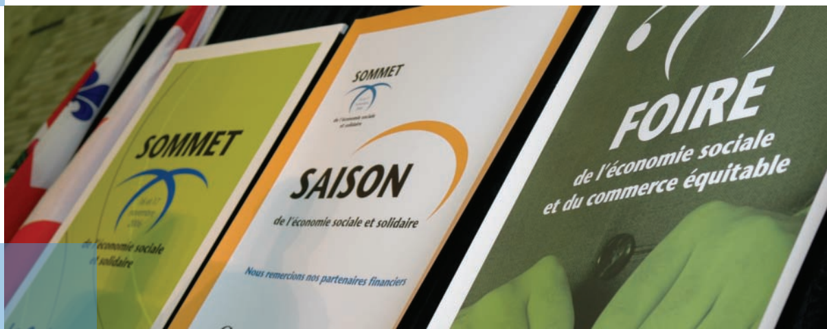
Sommet de l'économie sociale, novembre 2006

Pour sa part, le gouvernement du Québec, dans son récent Plan d'action gouvernemental pour l'entrepreneuriat collectif , détermine les stratégies qu'il entend mettre en place pour optimiser l'impact de l'économie sociale sur le développement des territoires. Ainsi, par des moyens concrets et adaptés aux réalités des initiatives d'économie sociale, le gouvernement vient appuyer les acteurs du milieu dans leurs réponses aux besoins des communautés. Le plan entend soutenir les pôles régionaux d'économie sociale créés en vertu d'un partenariat conclu entre des instances régionales d'économie sociale et le Chantier de l'économie sociale. À Montréal, le Comité d'économie sociale de l'île de Montréal (CÉSÎM), qui est « un comité-conseil de la CRÉ... [et] a pour mandat de faire la promotion de l'économie sociale à Montréal et de favoriser la concertation entre les intervenants locaux et régionaux afin d'harmoniser les actions et d'en maximiser les effets », agit à titre de pôle régional de l'économie sociale. 3 Pour la Ville de Montréal, le plan d'action gouvernemental propose de nouvelles mesures sur lesquelles le présent partenariat pourra appuyer son développement.