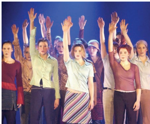
Festival intercollégial de danse