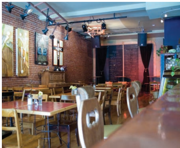
Bistro In Vivo, coopérative de travail

Sur un budget global de près de 3,9 milliards de dollars en 2006, la contribution de la Ville à l'économie sociale représente donc 0,8 % de ses dépenses. La place qu'occupe l'économie sociale dans ce budget est, somme toute, plutôt modeste et elle est relativement concentrée dans le secteur de l'habitation.