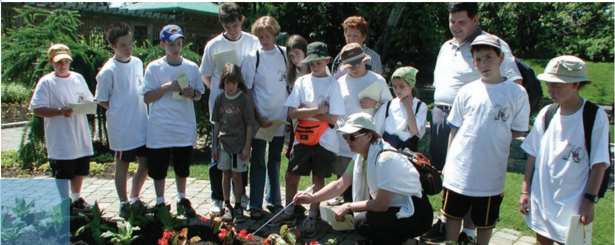
Apprentissage des sciences naturelles au Jardin botanique de Montréal