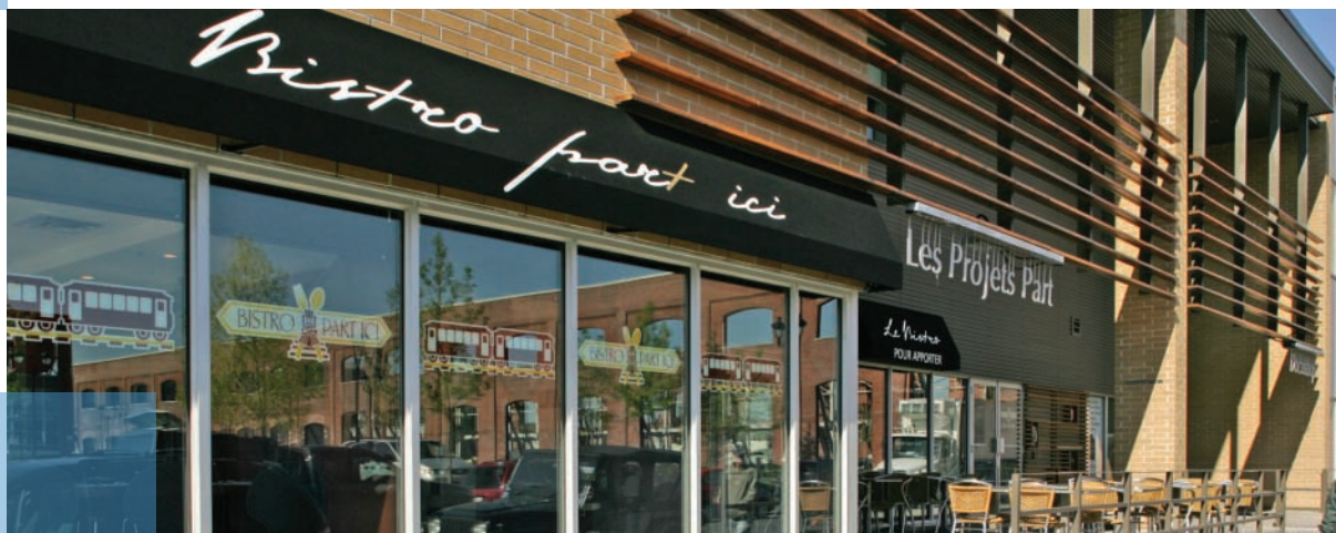
Bistro PART ici