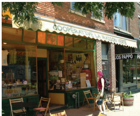
Coopérative La maison verte

Créées par les communautés et pour les communautés, les entreprises d'économie sociale s'inscrivent naturellement dans une approche de développement local. La concertation locale est un élément fondamental du déploiement de l'économie sociale, car celle-ci s'appuie sur les acteurs et les pratiques locales. À cet égard, il va de soit que les arrondissements jouent un rôle prépondérant. À leur échelle, les CDEC ont été, et sont toujours, des acteurs importants de l'économie sociale. En outre, depuis que le gouvernement du Québec a transféré à la Ville de Montréal la responsabilité du développement local, les CLD ont été mandatés pour soutenir le développement de l'économie sociale dans les arrondissements. D'autres organisations de soutien, tels la coopérative de développement régional Montréal-Laval (CDR), les groupes de ressources techniques (GRT) et les organisations de la finance solidaire, contribuent également à l'ancrage de l'économie sociale dans le développement de Montréal. 13