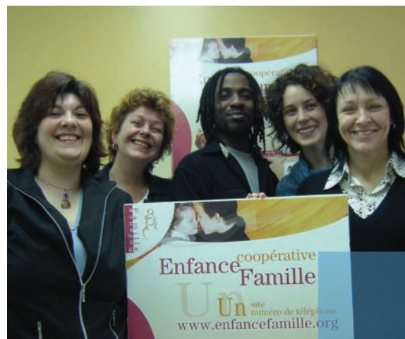
Coopérative Enfance Famille.org Technopôle Angus