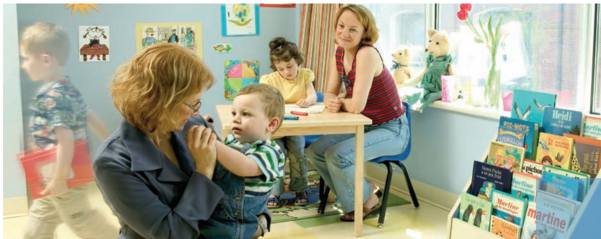
Garderie Coeur de Cannelle