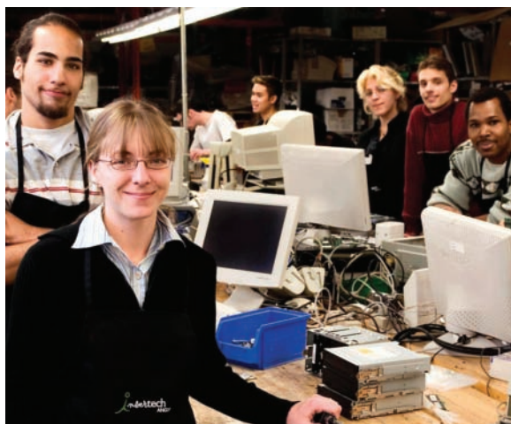
Insertech Angus, entreprise d'insertion sociale et professionnelle

L'accord de coopération qui a été conclu en 2006 entre les villes de Paris et de Montréal s'inscrit donc dans une tendance internationale. Cet accord cible en particulier l'enrichissement des connaissances mutuelles par le biais d'échanges sur les bonnes pratiques en économie sociale et sur les exemples de succès de part et d'autre.