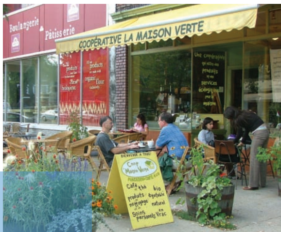
Coopérative La maison verte