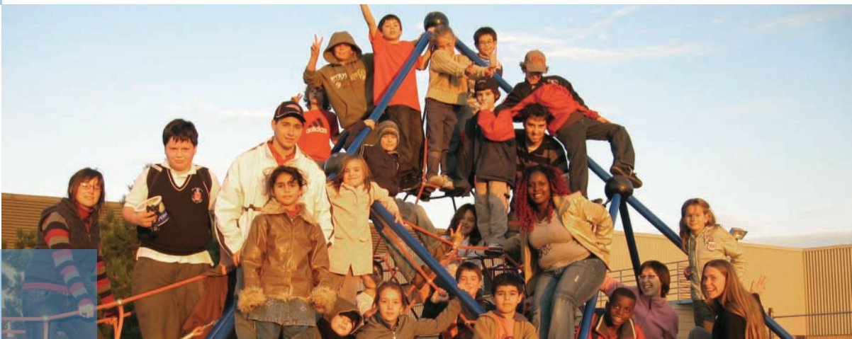
Activités organisées pour les enfants après l'école

Tout récemment, en janvier 2008, la Région Rhône-Alpes et la Chambre régionale de l'économie sociale et solidaire ont signé le premier contrat économique sectoriel ESS (économie sociale et solidaire) de France. Ce contrat définit une stratégie commune de développement comprenant une trentaine d'actions concrètes. Ainsi, l'économie sociale se voit reconnue avec force comme un secteur économique à part entière. Plus de 7 millions d'euros sur trois ans sont affectés au programme dont l'objectif est l'amélioration de la connaissance de l'économie sociale et solidaire, la consolidation et le développement des activités, le développement des emplois et des compétences et enfin la mise en place d'une gouvernance efficace autour du dialogue social. Dans la Région Nord-Pas de Calais, la ville de Lille a inscrit des pratiques d'achats responsables et de référence à des clauses éthiques et d'insertion socioprofessionnelle dans ses marchés publics.