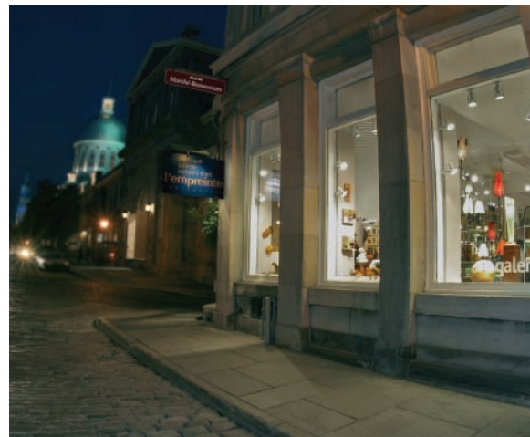
L'Empreinte, coopérative de producteurs