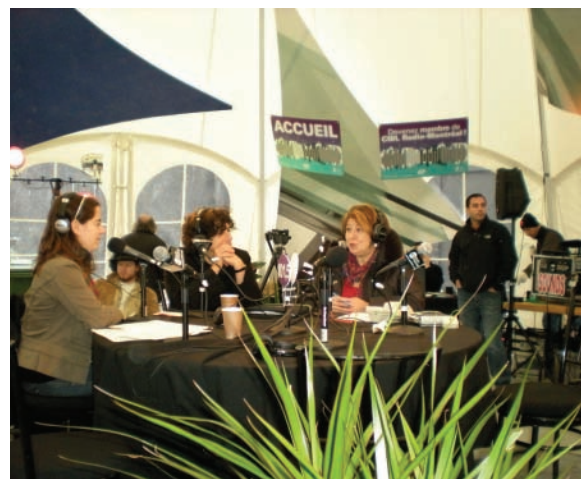
Diffusion de l'émission sur l'économie sociale À l'échelle humaine lors du Radiothon 2008 de CIBL Radio Montréal 101,5 FM