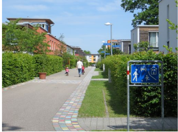
Des milieux de vie adaptés aux familles