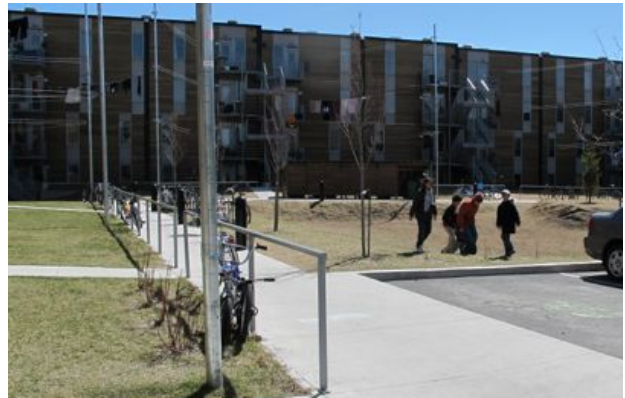
Coopérative d'habitation Le Coteau Vert

Développer une offre de logements pour tous les revenus et tous les besoins est un défi de taille, surtout lorsqu'on considère l'évolution des prix dans les dernières années à Montréal. Si les questions de logement social sont étroitement liées aux programmes québécois et fédéraux, la Ville est en mesure d'influencer la proportion de logements sociaux, mais aussi abordables, dans les nouveaux projets. Vivre en Ville contribue de différentes façons à la réflexion entourant ces questions en faisant valoir des solutions telles que l'autopromotion. Nous insisterons ici davantage sur un des enjeux de l'abordabilité, la rétention des familles.