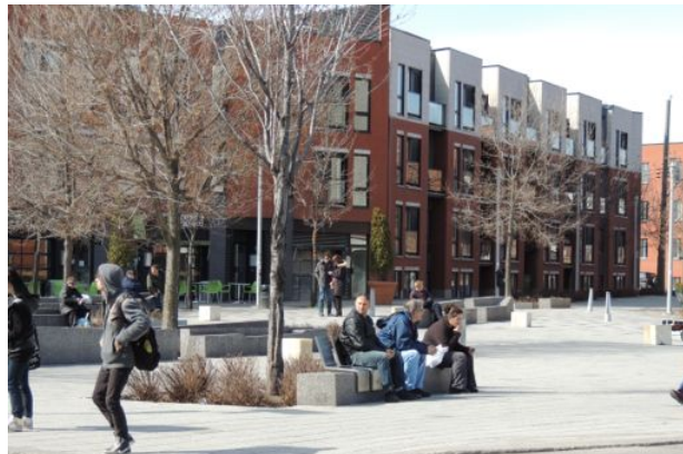
Espaces publics animés et de qualités