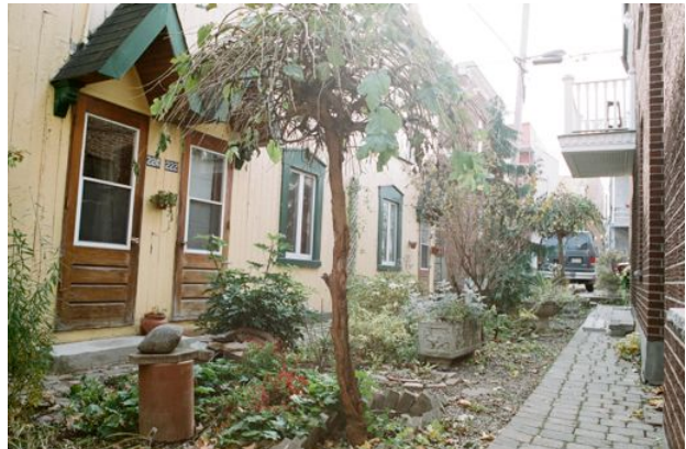
Ruelle conviviale dans le quartier Peter-McGill

Des espaces publics verts et de qualité permettent donc de supporter une panoplie d'objectifs du Plan de développement. Ils concourent aussi à la vision proposée ici, soit que Montréal se positionne d'ici 20 ans parmi les 10 collectivités les plus viables. Rappelons qu'un espace public de qualité encourage les déplacements actifs, contribuant à l'adoption de saines habitudes de vie. Remplacer l'asphalte inutile par des végétaux contribue aussi à la lutte aux îlots de chaleur urbains.