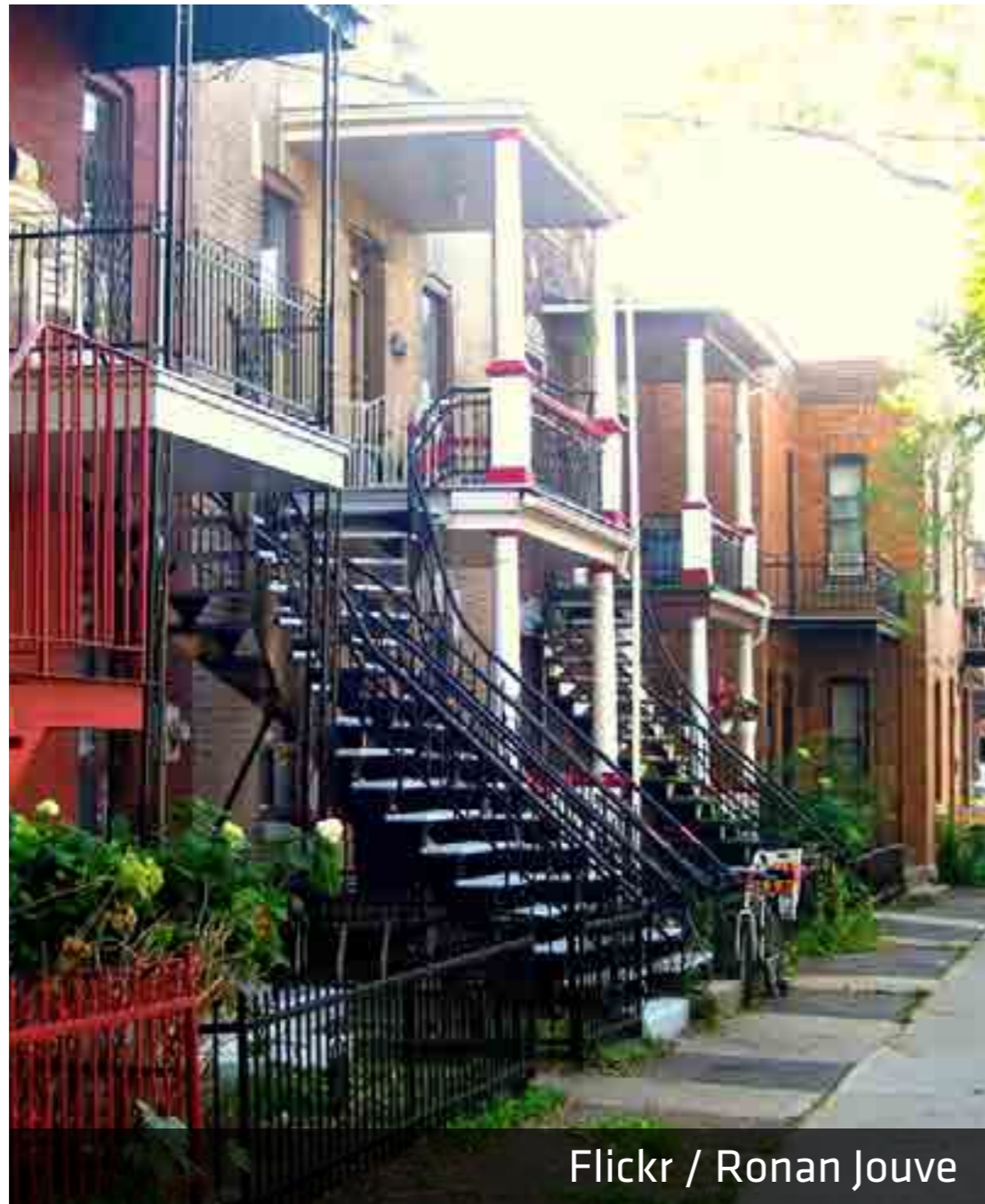
Flickr / Ronan Jouve

Recommandation Définir le modèle montréalais de densité