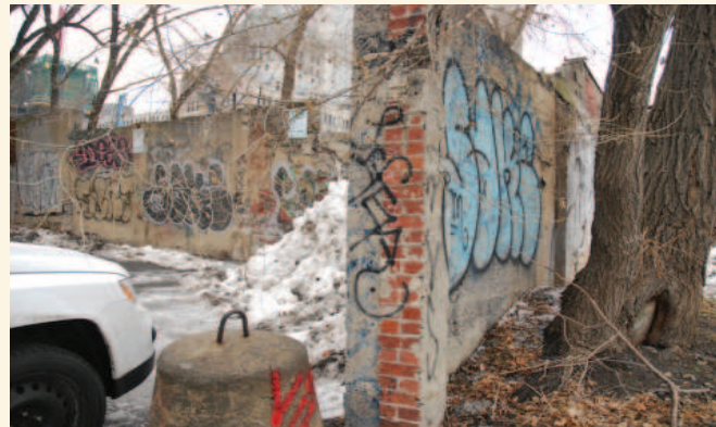
Vestiges du mur d'enceinte du terrain à l'est et au sud du bâtiment