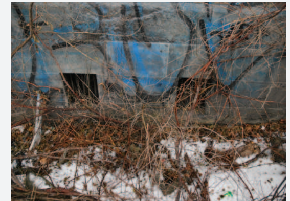
Barreaux dans les soupiraux (cellules) du sous-sol