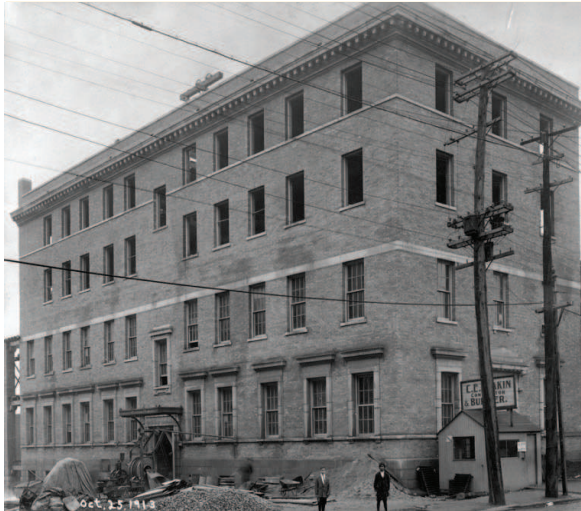
L'édifice en construction en octobre 1913

La valeur architecturale du 1162, rue Saint-Antoine Ouest repose sur :