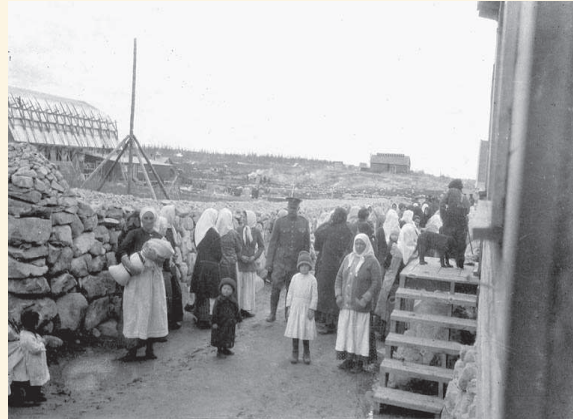
Camp familial de Spirit Lake en Abitibi (Québec) © Library and Archives Canada / Bibliothèque et Archives Canada, PA-170620