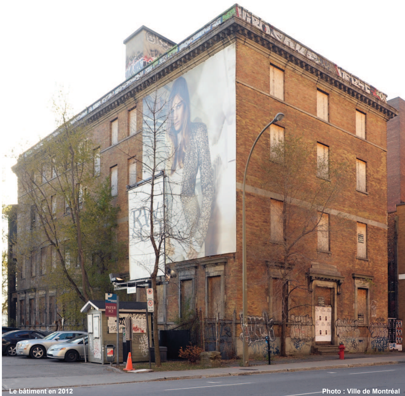
Le bâtiment en 2012

Pour ce qui est de sa valeur urbaine, le bâtiment profite de sa proximité avec la gare Windsor, avec laquelle il a entretenu une étroite relation historique. Il s'inscrit en outre dans le mouvement de Montréal métropole, dont il constitue un des derniers témoins dans ce secteur, avec la gare Windsor et l'édifice des Postes.