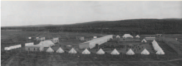
Camp de détention des ennemis du Canada pendant la Première Guerre mondiale à Valcartier, près de Québec

La valeur symbolique du 1162, rue Saint-Antoine Ouest repose sur :