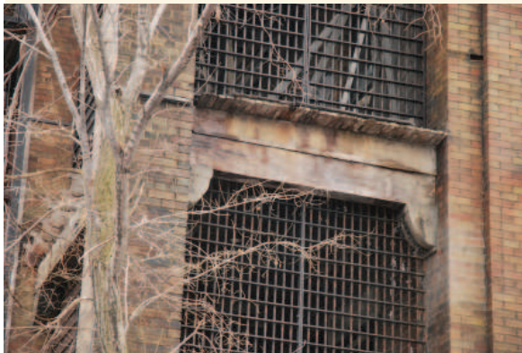
Barreaux entourant les galeries arrière des étages