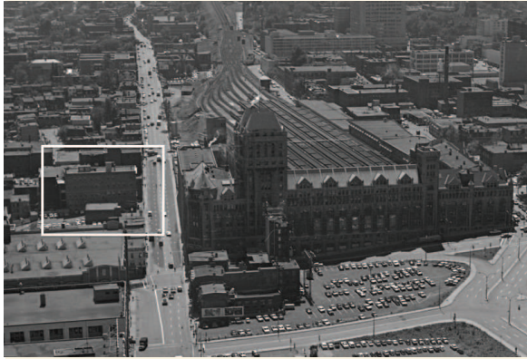
Le site et le voisinage de la gare Windsor en 1964

La valeur urbaine du 1162, rue Saint-Antoine Ouest repose sur :