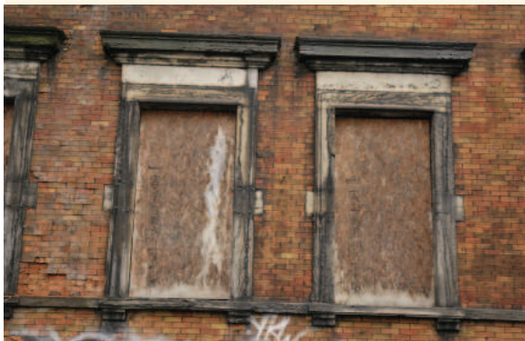
Détail des encadrements de fenêtres en pierre