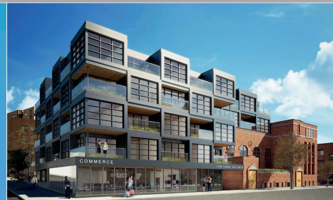
Projet immobilier du Carré des Arts

Demander à recevoir le rapport : rapport@ocpm.qc.ca