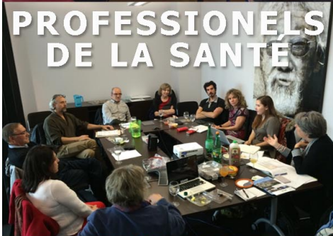
PROFESSEURS DE LA SANTÉ