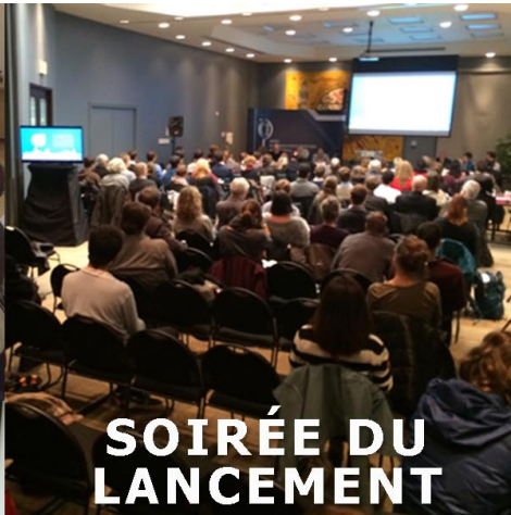
SOIRÉE DU LANCEMENT