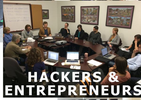
HACKERS & ENTREPRENEURS