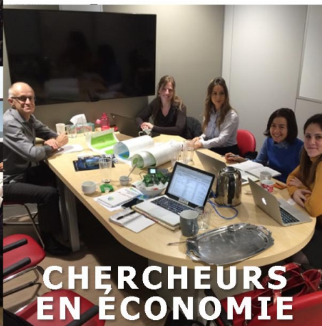
CHERCHEURS EN ÉCONOMIE