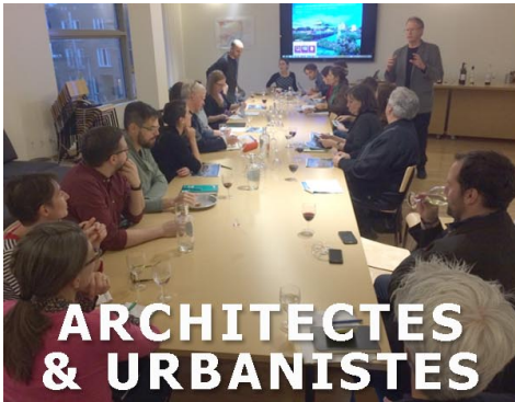
ARCHITECTES & URBANISTES