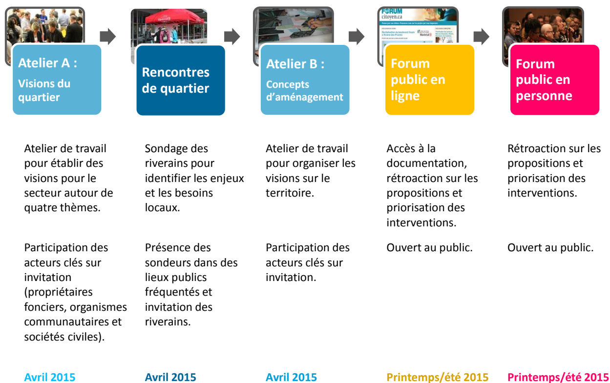
Figure 2 Démarche de planification participative

Cette démarche comprend cinq activités complémentaires (voir figure 2) qui permettront de joindre les différents publics concernés par l'avenir du secteur et d'accompagner la réflexion de l'arrondissement dans les différentes étapes de sa planification.