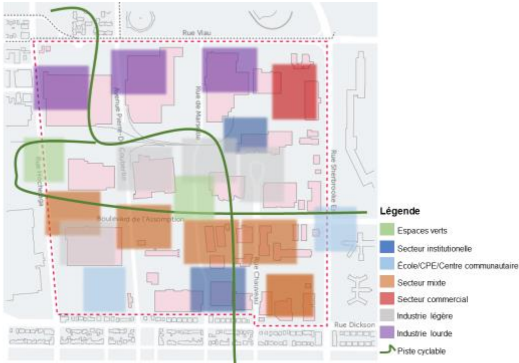
Figure 1 Concept d'aménagement élaboré par le groupe 1 lors de l'atelier

Le concept d'aménagement élaboré par le groupe 1 comporte les éléments suivants :