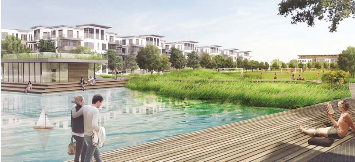
Aménagement proposé pour le parc municipal du secteur Cap-Nature