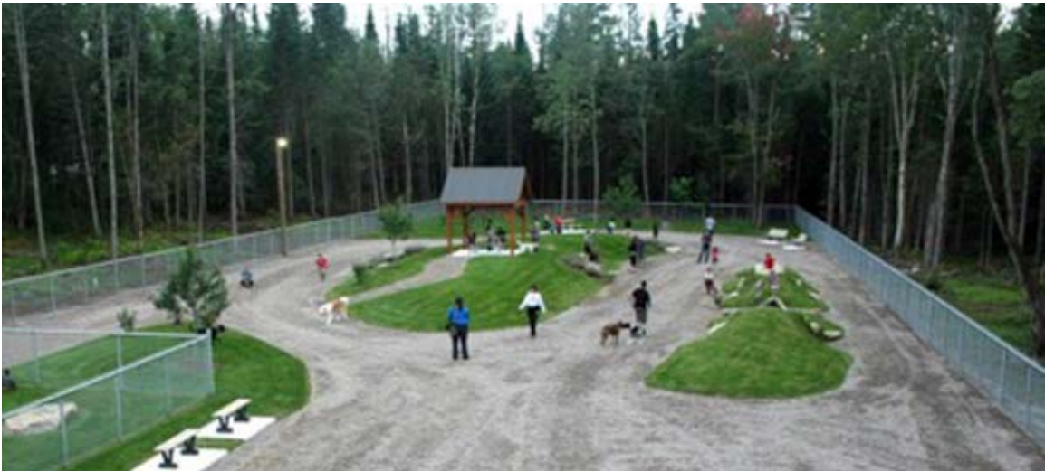
Aménagement type d'un parc pour chien (ville de St-Catherine-de-la-Jacques-Cartier)

Suite au démarrage de chacune des phases du projet Cap-Nature, les citoyens verront se compléter le réseau de parcs avec l'apparition de parcs locaux à l'usage des résidents de chacun des secteurs. Ces parcs de plus petites dimensions, soit des superficies variant entre 1000 et 4000 mètres carrés, seront conçus de manière à répondre à des besoins quotidiens et diversifiés allant du traditionnel parc à jeu pour enfant aux des sentiers d'exercice pour adultes en passant par les parcs canins.