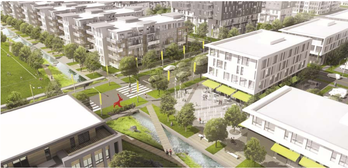
Vue aérienne de la première section du canal Est-Ouest dans le projet Cap-Nature

Dans la première section du projet, nous proposons une vision très urbaine avec un canal artificiel construit qui créera une zone tampon naturelle entre le secteur commercial et le secteur résidentiel. Suite à cette première section, la promenade prendra une apparence plus organique à la rencontre du parc municipal avant de se transformer en lac. En contiguïté à ce lac, les résidents pourront se rassembler au pavillon de la ville qui s'occupera de la gestion du parc municipal en plus d'informer la population sur les différents aspects éco-responsables du quartier.