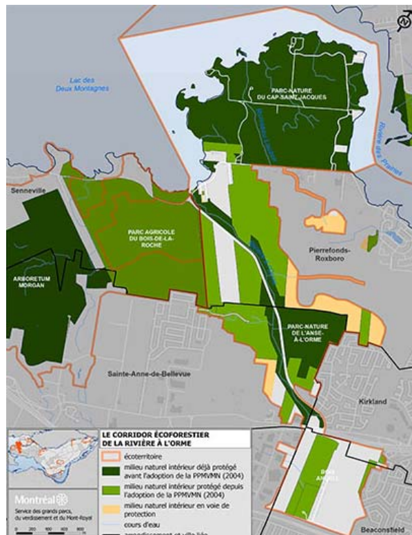
Projet de corridor éco forestier de la rivière à l'Orme

Comme vous le savez, la planification du projet Cap-Nature s'applique à un territoire d'une superficie de 365 hectares, actuellement composé majoritairement de terres en friche, de milieux humides et de forêts. De ces 365 hectares, dès le début des premières phases de construction, une superficie de 180 sera cédée à la ville de manière à venir s'ajouter aux différents boisés et parcs déjà protégés dans l'Ouest de l'île de Montréal. Cette donation, en plus de constituer un écosystème autonome en soi pour la faune et la flore présente dans le secteur, viendra compléter la mise en réseau des différents grands parcs de l'Ouest de l'île afin de former le projet du corridor éco forestier de la rivière à l'Orme qui comprendra plus de 1 000 hectares, soit plus de 4 fois la superficie actuelle du Mont-Royal.