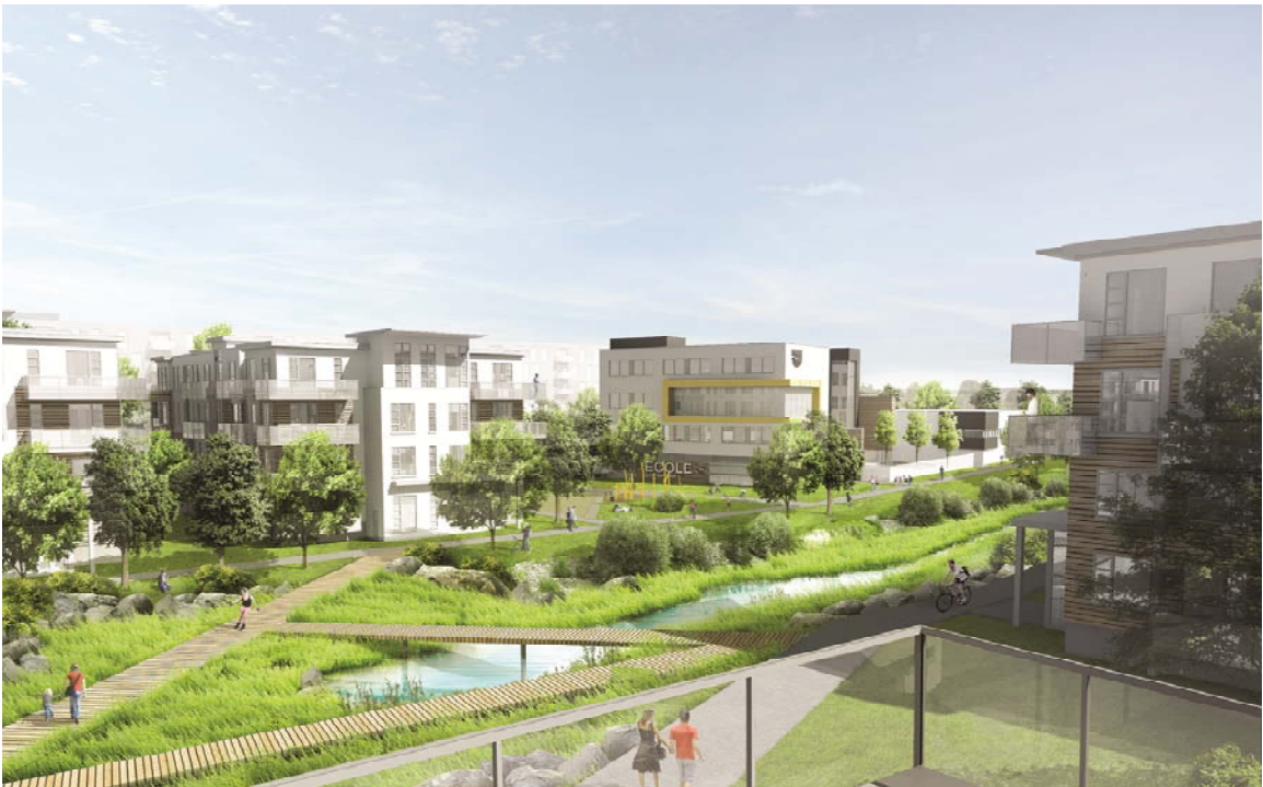
Vue de la première des 3 écoles primaires que comportera le projet Cap-Nature

Après avoir profité des différentes installations municipales autour du lac, les résidents pourront poursuivre leur parcours à travers les multiples sentiers qui longeront l'actuel ruisseau A qui les conduira dans un premier temps jusqu'à la première des trois écoles primaires avant de les mener jusqu'à l'entrée principale du parc de conservation, dans une ambiance plus naturelle, au milieu des hautes herbes.