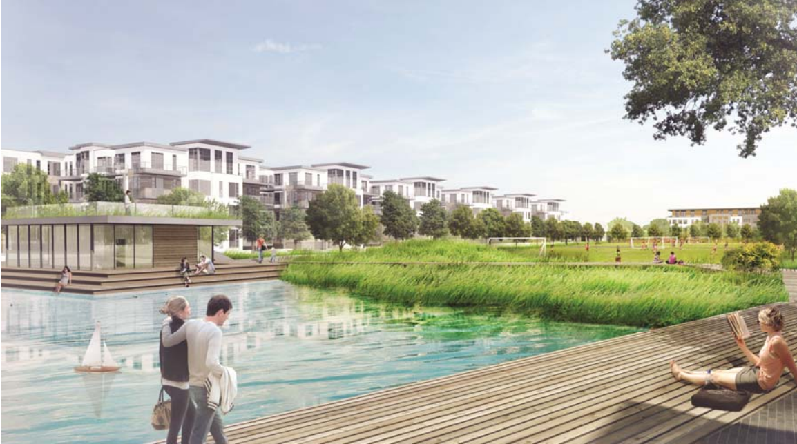
Vue d'ensemble de la seconde section du canal Est-Ouest dans le projet Cap-Nature et du pavillon de la ville de Montréal

Après avoir profité des différentes installations municipales autour du lac, les résidents pourront poursuivre leur parcours à travers les multiples sentiers qui longeront l'actuel ruisseau A qui les conduira dans un premier temps jusqu'à la première des trois écoles primaires avant de les mener jusqu'à l'entrée principale du parc de conservation, dans une ambiance plus naturelle, au milieu des hautes herbes.