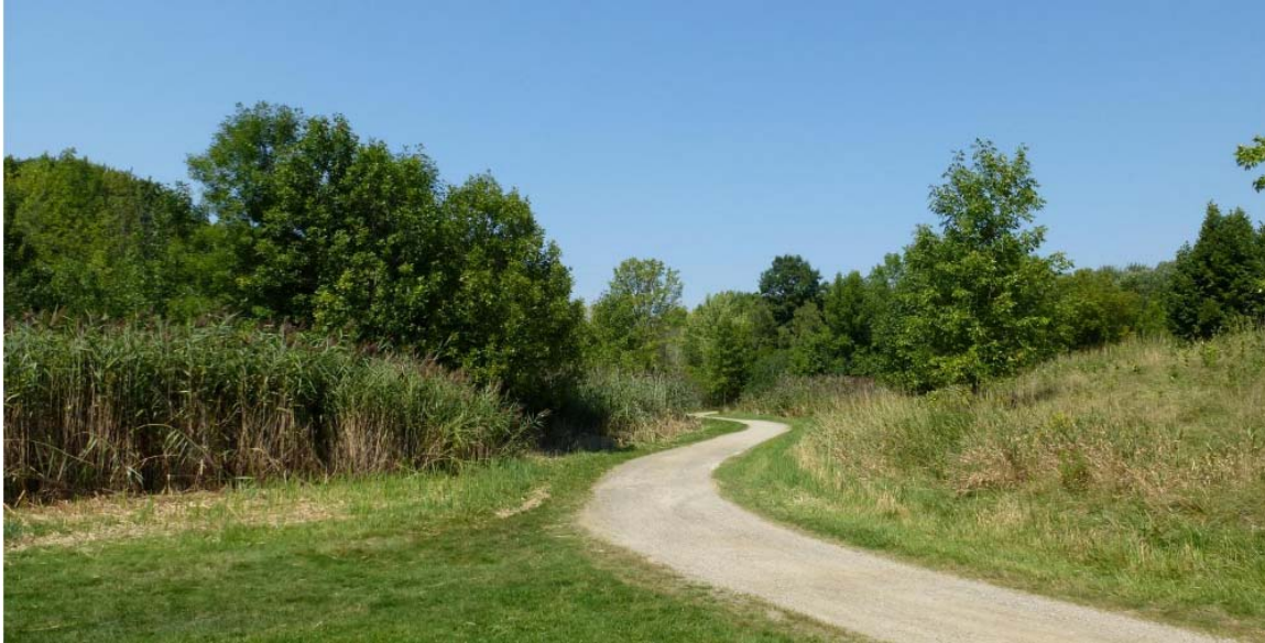
Exemple d'aménagement tel qu'on en retrouve au parc nature de la pointe-aux-prairies

Ce parc, en plus de servir à la préservation de la vie sauvage, suite à son aménagement par la ville de Montréal dans son ensemble et par Canard illimité au niveau des différents milieux humides, servira de lieu de détente et d'interprétation pour l'ensemble des citoyens de l'agglomération de Montréal en constituant une représentation de différents écosystèmes qui composent le Sud-ouest du Québec.