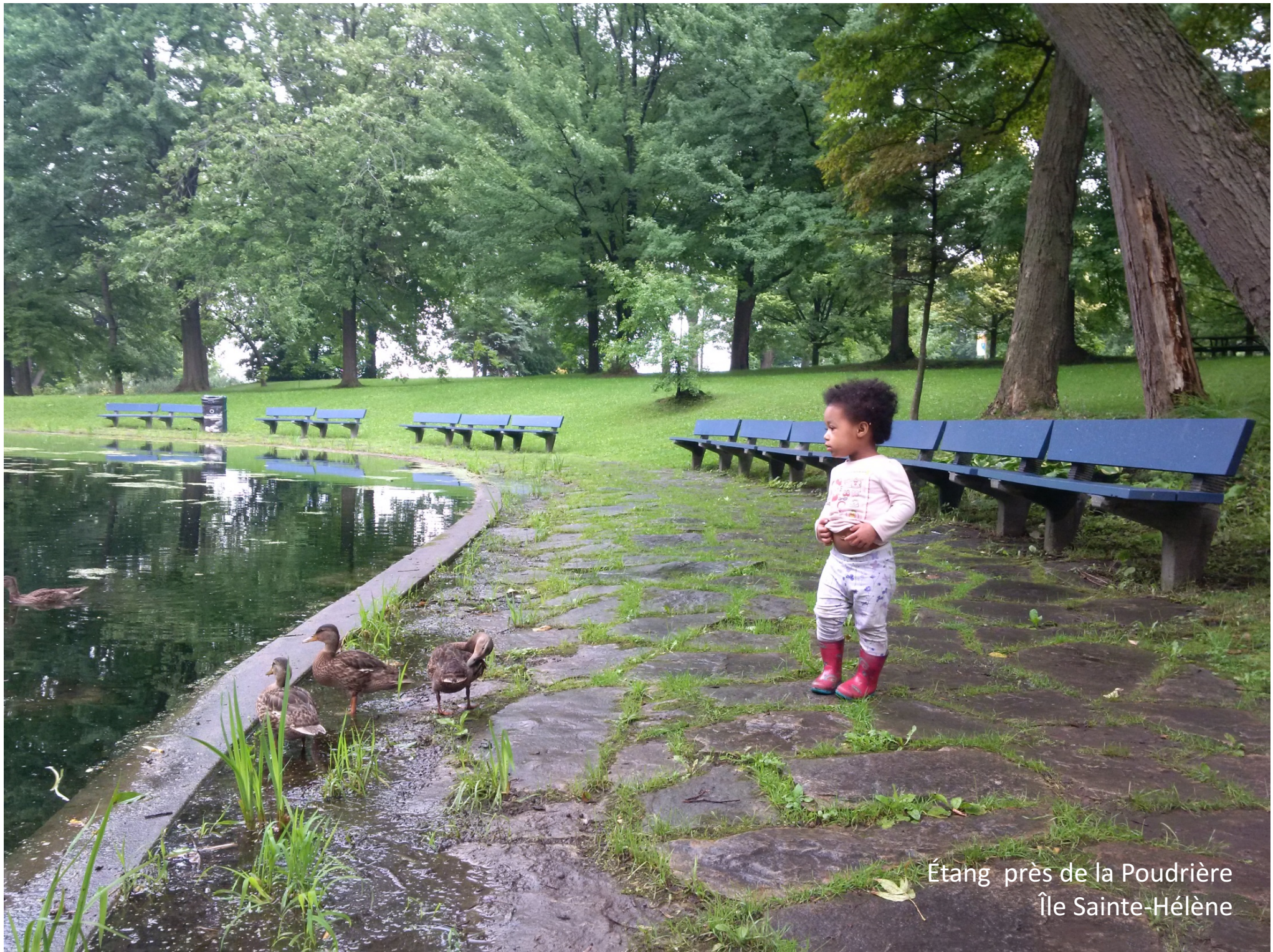
Étang près de la Poudrière Île Sainte-Hélène