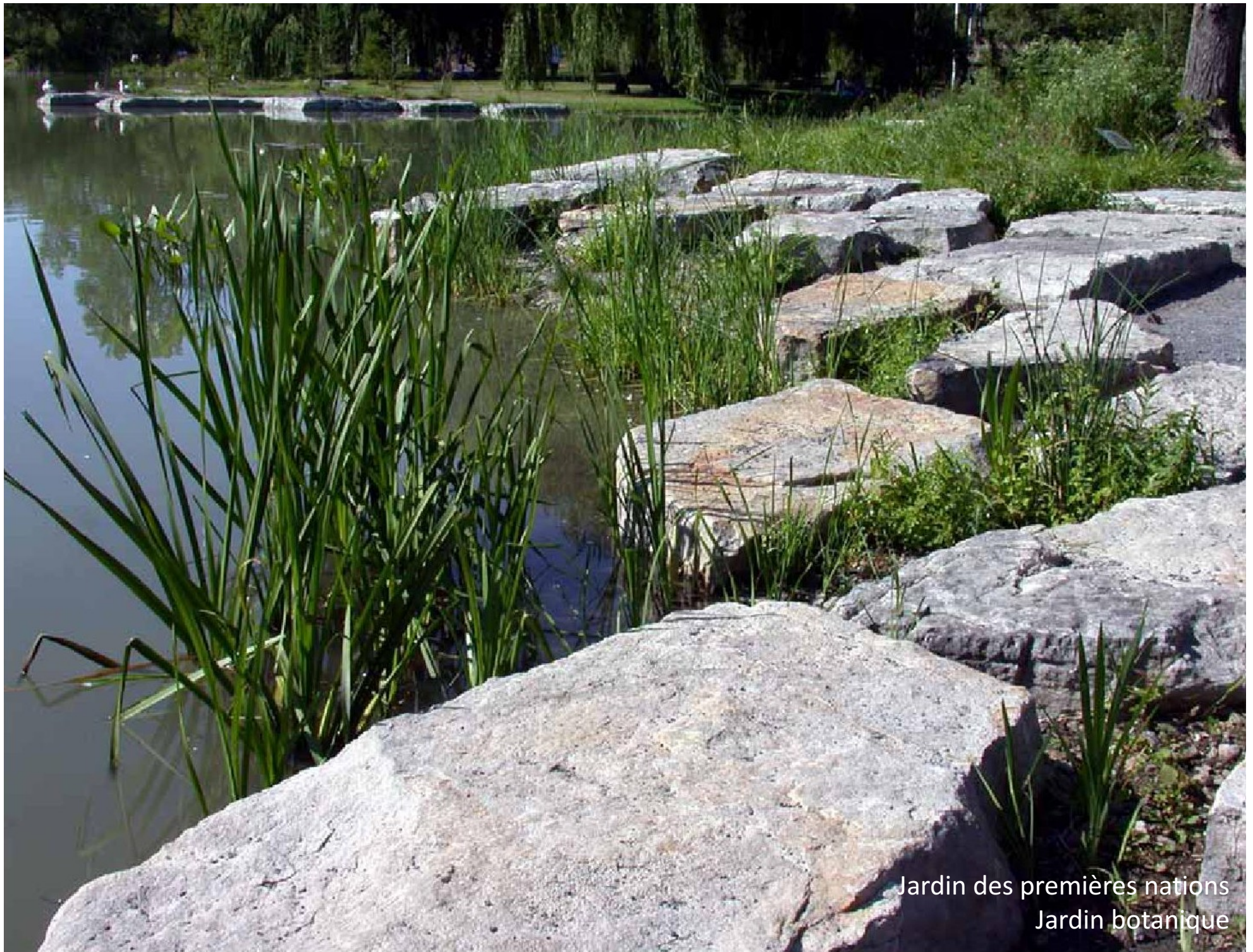
Jardin des premières nations Jardin botanique