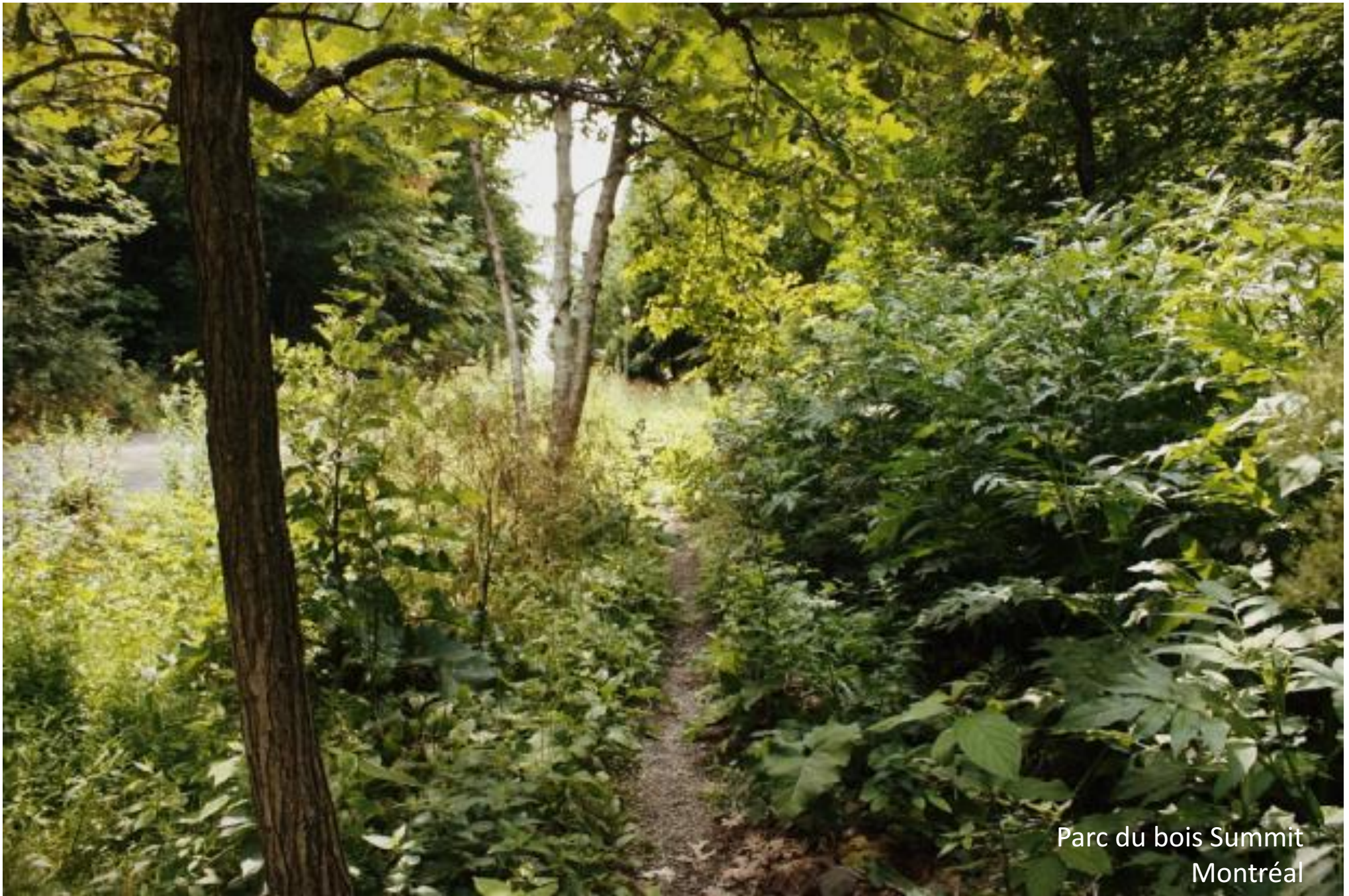
Parc du bois Summit Montréal