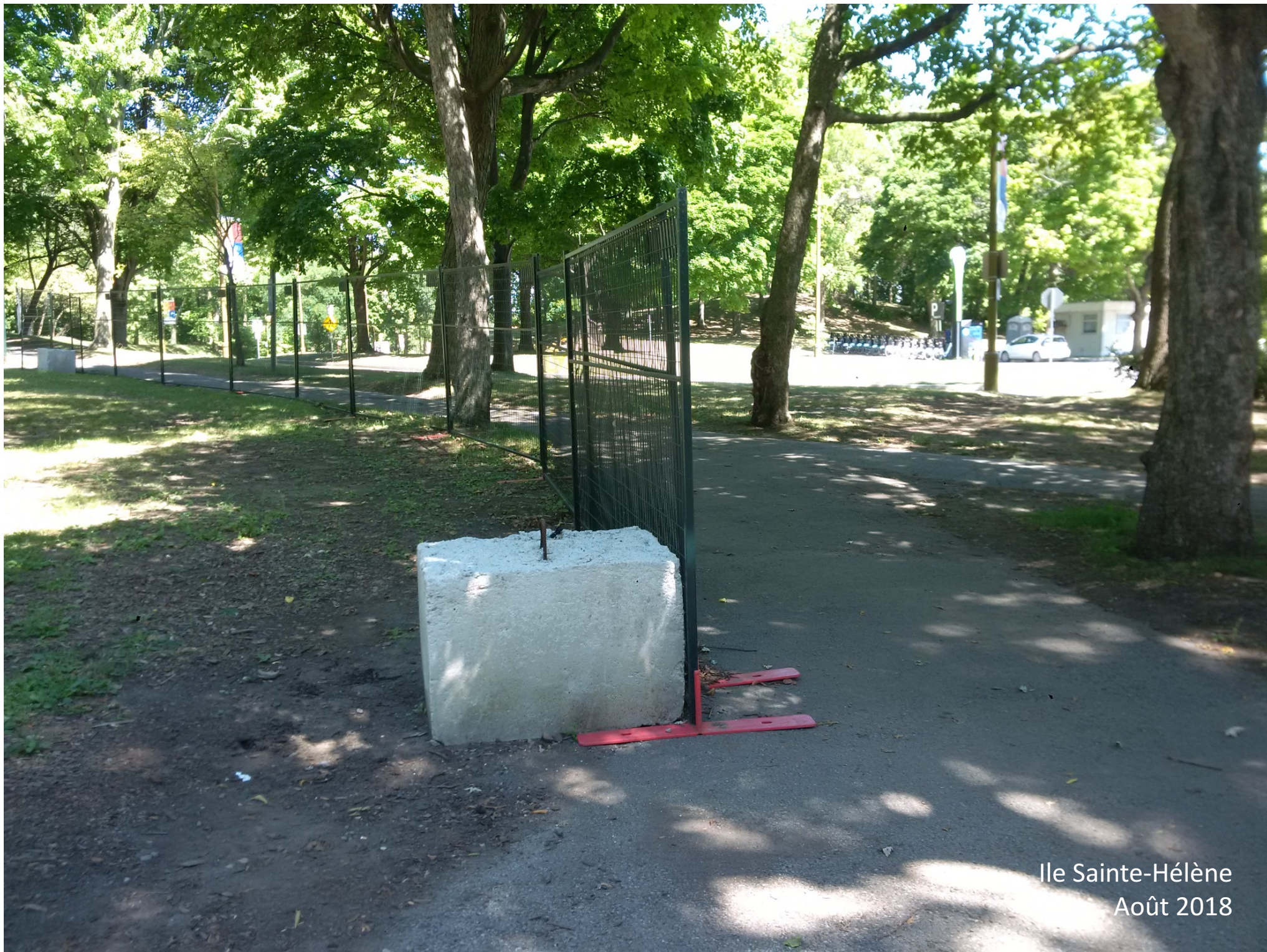
Ile Sainte-Hélène Août 2018