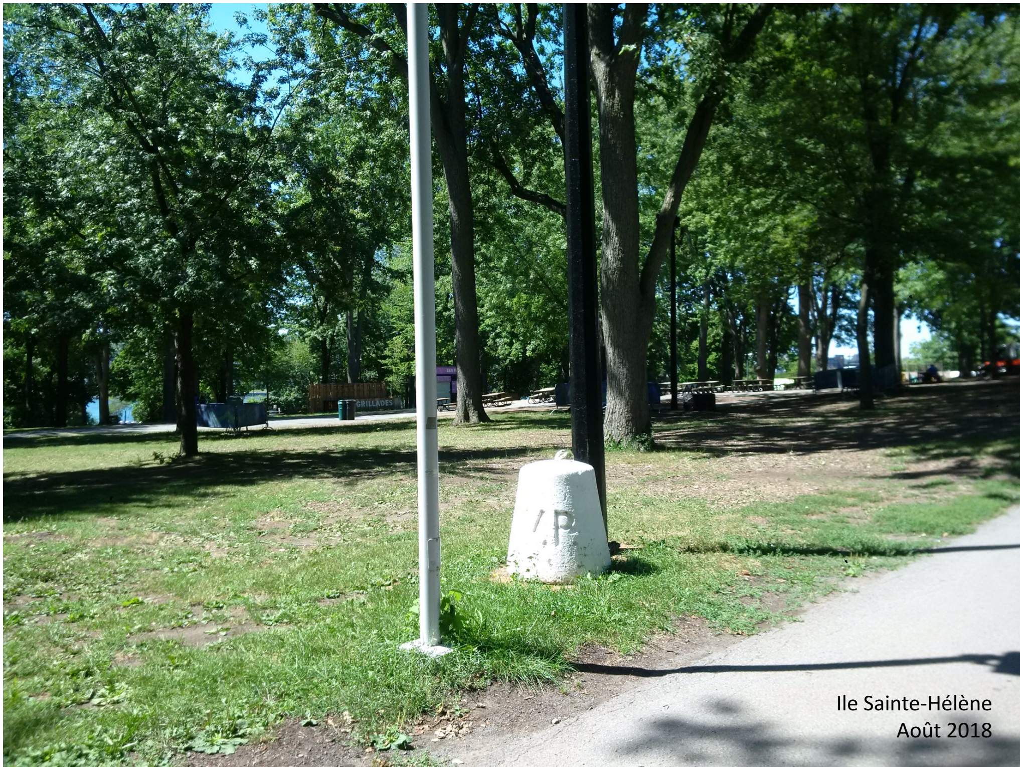
Ile Sainte-Hélène Août 2018