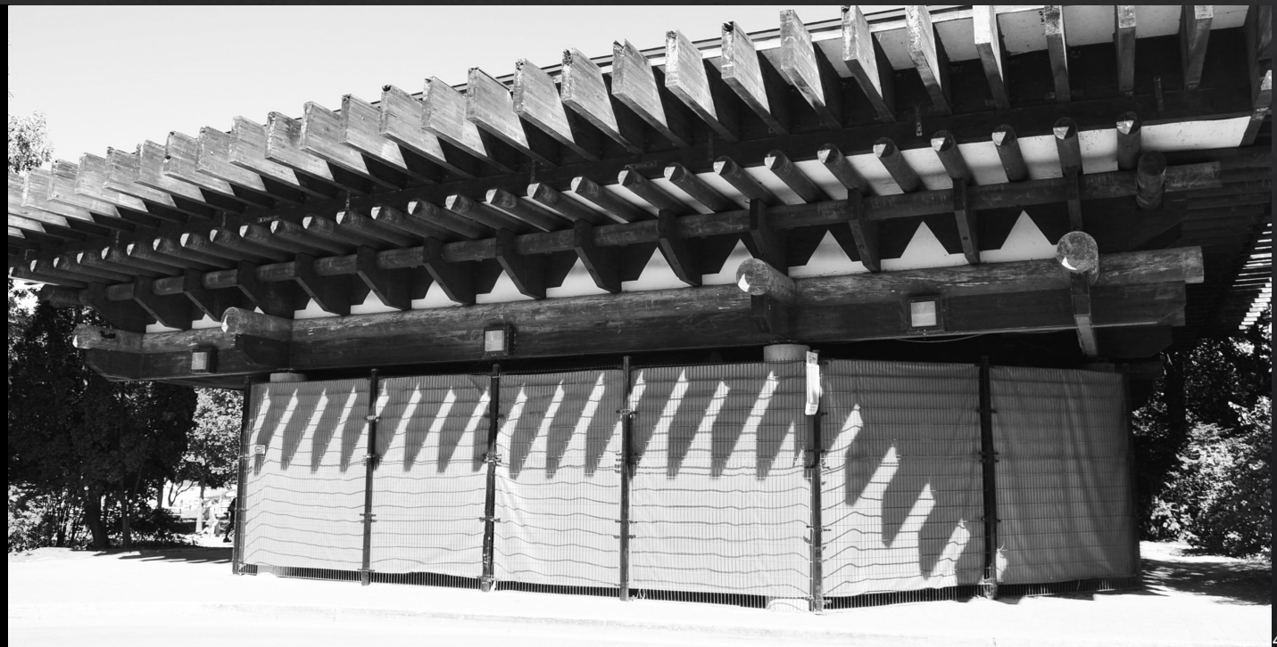
LE PAVILLON DE LA CORÉE 한국관 KOREAN PAVILION (2015)