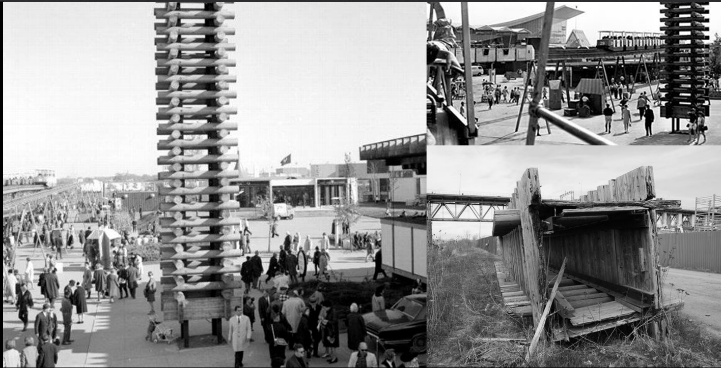
LA PAGODE 탑 PAGODA (1967 & 2012)