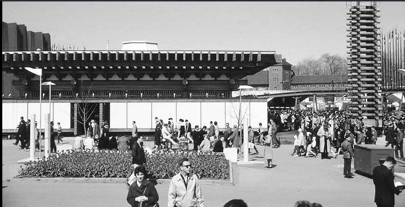
LE PAVILLON DE LA CORÉE 한국관 KOREAN PAVILION (1967)