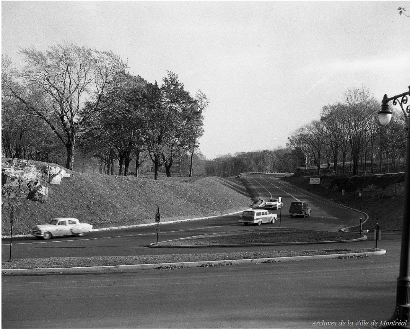
Archives de la Ville de Montréal