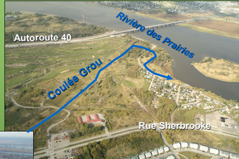
Bassin de la Coulée Grou