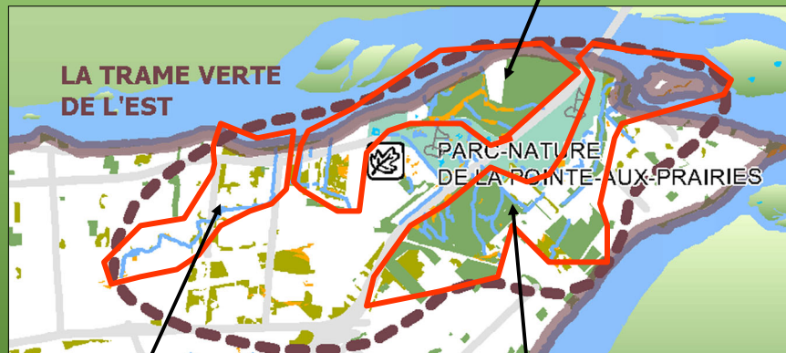
Bassin du ruisseau Pinel