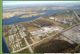
Terrain adjacent à la rivière des Prairies