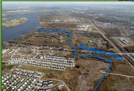
Bassin du ruisseau Pinel

Assurer une alimentation d'eau adéquate au ruisseau Pinel, à la Coulée Grou et aux marais de tête ainsi qu'une eau de qualité