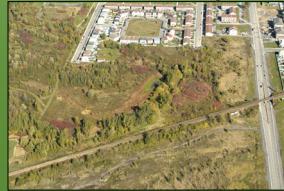
La tête du bois de l'héritage