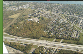
Le bois de la Réparation