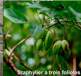
Staphylier à trois folioles